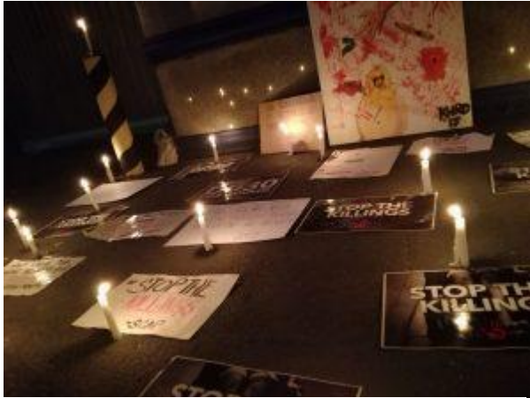
Kerzen als Zeichen der Trauer und des Protests

Aber bis zu diesem Zeitpunkt wurde keine einzige Person für einen der Morde juristisch verantwortlich gemacht – nicht einmal für die zehntausenden Toten (obwohl vor kurzem es eine Entscheidung eines Gerichts in Manila gab, die den Bericht eines Polizeieinsatzes ablehnte, die als bescheidener Präzedenzfall diene). Der „Drogenkrieg“ wird als „Krieg“ gegen die Ärmsten der Armen bezeichnet; eine Kampagne zur „sozialen Säuberung,“ die nur diejenigen an den sozialen Rändern verfolgt.