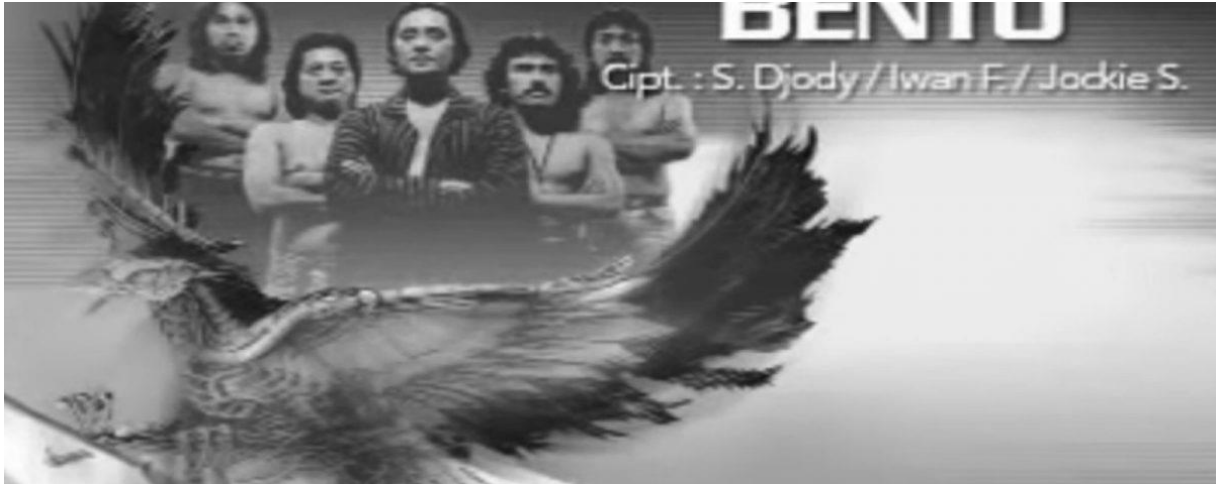
Iwan Fals: Bento, Video-Ausschnitt

Ich heie Bento, bin stinkreich Hab viele Limousinen, Immobilien Die Leute nennen mich Big Boss Bin einer von denen, die ber allem steh'n Wie geil!