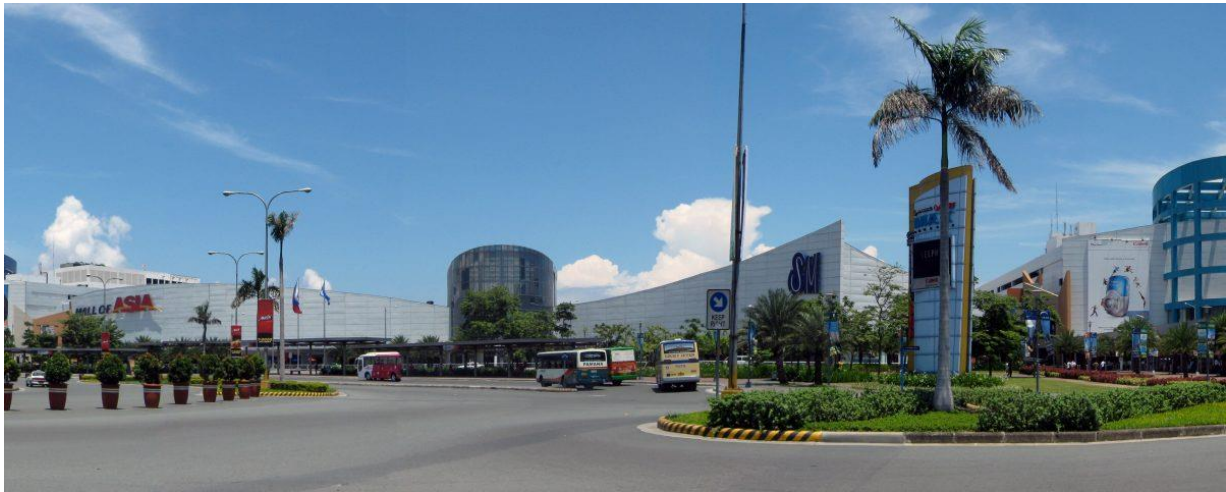
Mall of Asia

Das Forbes Magazin listet jedes Jahr die reichsten Menschen der Welt auf, unter welchen auch mehrere philippinische Unternehmer sind. Doch im Zusammenhang mit dem geschätzten Vermögen steht auch die Frage, wie diese Vermögen akkumuliert wird. Also die Frage, welche Unternehmen den jeweiligen Personen gehören bzw. an welchen sie beteiligt sind und die ihnen zu diesem Vermögen verhelfen. Dabei bringt eine genauere Auflistung auch größere Transparenz und eine bessere Vorstellung des Kapitals und somit auch der Macht, die damit einhergeht.