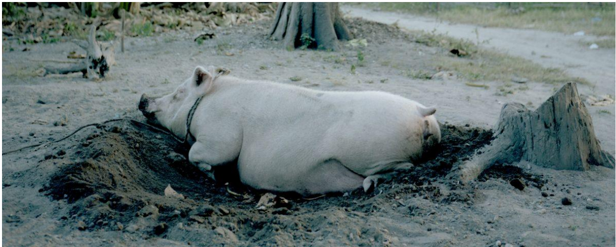
Schweinefleisch bekommt eine mehrfache Bedeutung

Reichtum kann sowohl auf individueller als auch auf gesellschaftlicher Ebene generiert werden. Ein System, das für die Entwicklung einzelner Regionen in Hinsicht auf die Schaffung besserer Infrastruktur, einer besseren medizinischen Versorgung und besseren Bildungsmöglichkeiten gedacht war und damit mehr gesellschaftlichen Reichtum schaffen sollte, bestand aus Entwicklungsfonds., wie dem Country Development Fund (CDF) oder dem Priority Development Assistance Fund (PDAF). Diese Fonds waren dabei in der Realität oft mehr politische Instrumente als wirkliche Entwicklungsinstrumente und als solche auch anfällig für politische Korruption.