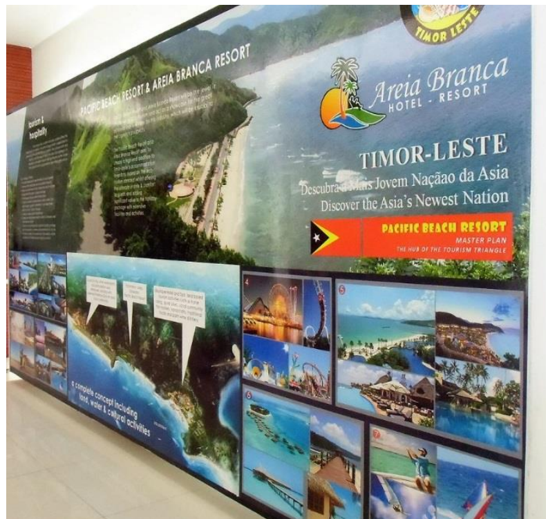
Wer profitiert von dieser Form des Tourismus

Zwei der kapitalintensivsten Projekte der Regierung befinden sich in abgelegenen Regionen und stehen unter starker Kritik. An erster Stelle steht das Tasi Mane Projekt, an der Südküste der Insel. Das Projekt basiert auf Plänen für eine zukünftige Erdölindustrie und sieht den Bau einer Raffinerie, eines