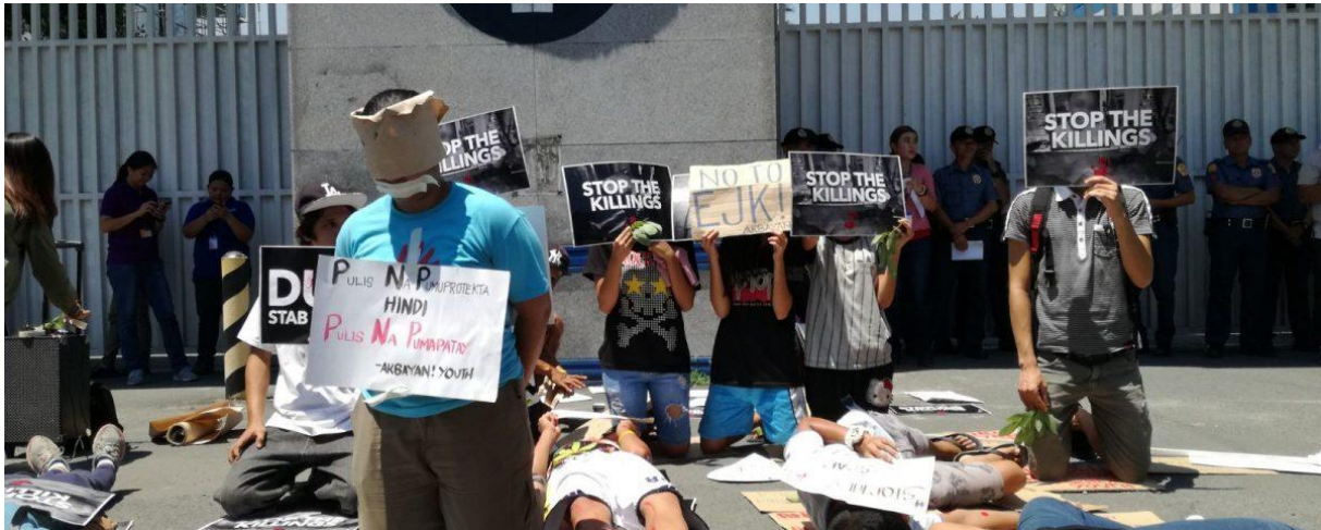
#StopTheKillings Proteste in Manila im September 2017