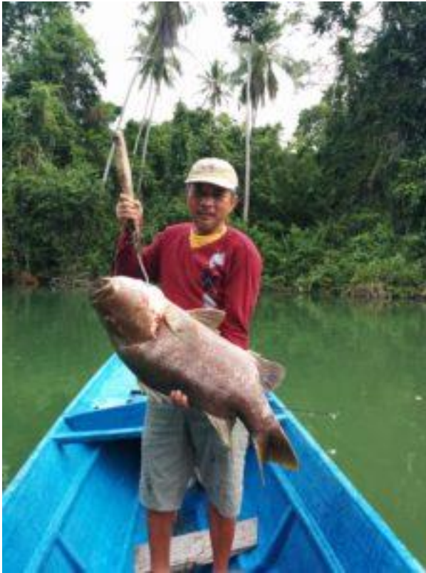
Der Fischhändler als Hobbyangler mit einem Barsch

Es kam auch oft vor, dass Win 20 bis 30 Millionen Rupiah an Fischer verlieh, damit diese sich Motorbote kaufen konnten. Und dann gab es immer wieder Fischer, die das Geld nicht zurückzahlen konnten. Aber das war für ihn nie ein Problem. Nach Angaben von Leuten, die ihm nahe stehen, hat er nicht einmal versucht, die Schulden einzutreiben. Irgendwann haben die Fischer dann das Geld von sich aus zurückgezahlt.