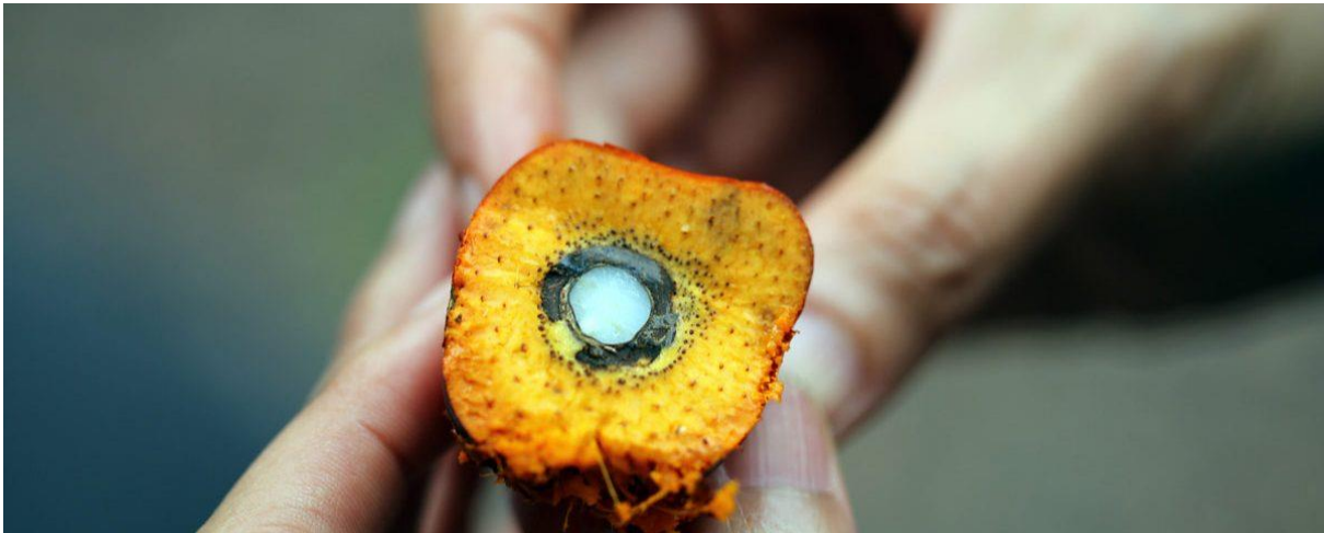
Stück einer Palmölfrucht