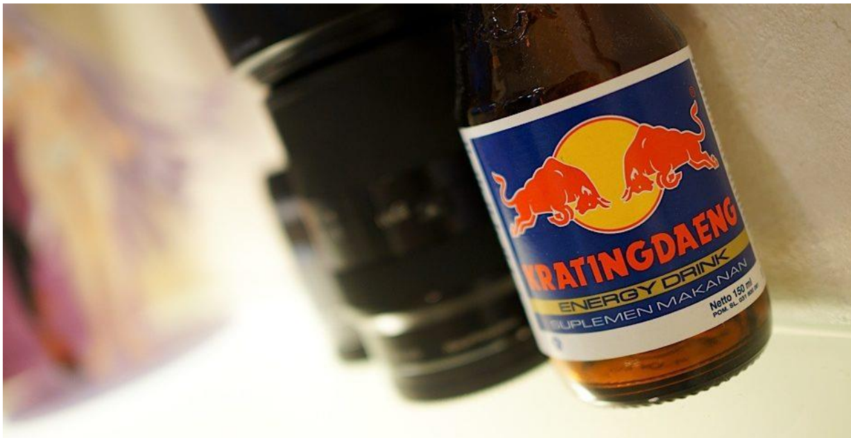
Red Bull

Die Forbes-Liste der reichsten Menschen in Thailand (siehe Tabelle) gibt einen guten Überblick über Milliardäre und Multi-Millionäre und sie bildet die Geschichte der Kapitalakkumulation in Thailand gut ab, in Bezug darauf, wer wie und wann reich geworden ist. Doch ignoriert die Liste sowohl Staats- als auch Auslandskapital – beide sind heute wichtige Wirtschafts-Akteure. Das vorherrschende Muster des Kapitaleigentums in Thailand und in anderen asiatischen Ländern der so genannten nachholenden Industrialisierung ähnelt einem Dreigestirn aus Staatsbetrieben, inländischen, privaten Unternehmen (meist Familienbetriebe) und ausländischen oder multinationalen Firmen.