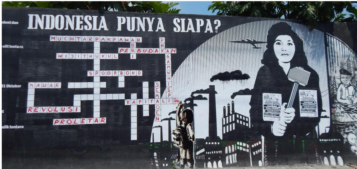
Indonesien Street Art