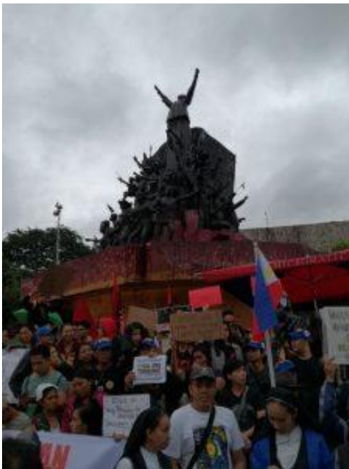
Der Protest braucht Basisallianzen, damit auch Marginalisierte ihre Stimme erheben.

Der erste Gerichtsfall , der die nationale Polizei unter Duterte behandelte, wurde erst mehr als ein halbes Jahr nach seinem Amtsantritt zur Kenntnis genommen, wo bereits Tausende getötet wurden. Und das sagt viel über das Justizsystem des Landes aus. Laut einer Menschenrechtsorganisation war der Fall trotzdem eine „Gelegenheit, die Stärke und Integrität der philippinischen Gerichte zu testen.“ Aber seit Dezember 2017 befindet sich der Fall noch in einer vorläufigen Untersuchung. Und es wurde durch unabhängige Berichte bewiesen, dass die Polizei gelogen hatte. Es ist mehr als Jahre her und wir müssen noch auf einen erfolgreichen Fall warten, in dem ein Beamter vor Gericht gestellt wird.