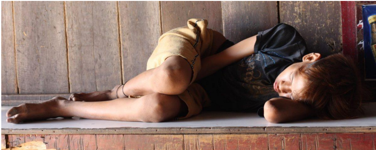
Philippinen, Alltag