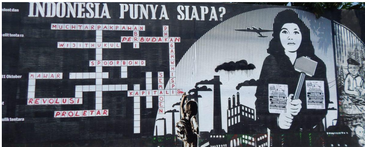
Indonesien Street Art, © Anett Keller

Die südostasien verbindet. Sie verbindet Menschen und soziale Bewegungen in Südostasien und Europa. Diese Menschen und Bewegungen eint, dass sie miteinander in einen herrschaftskritischen und solidarischen Dialog treten wollen. südostasien versteht sich als pluralistisches Forum, als Diskussionsraum für Akteur*innen mit Nähe und Kenntnis zu soziale Bewegungen.