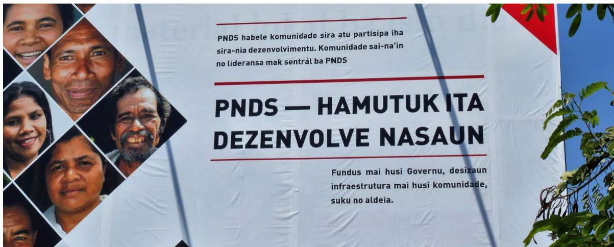
Regierungsprogramm zur Entwicklungspolitik

Osttimors Wirtschaft ist geprägt von Ressourcenausbeutung und Infrastruktur-Großprojekten. Die Einnahmen fließen in die Taschen der Eliten