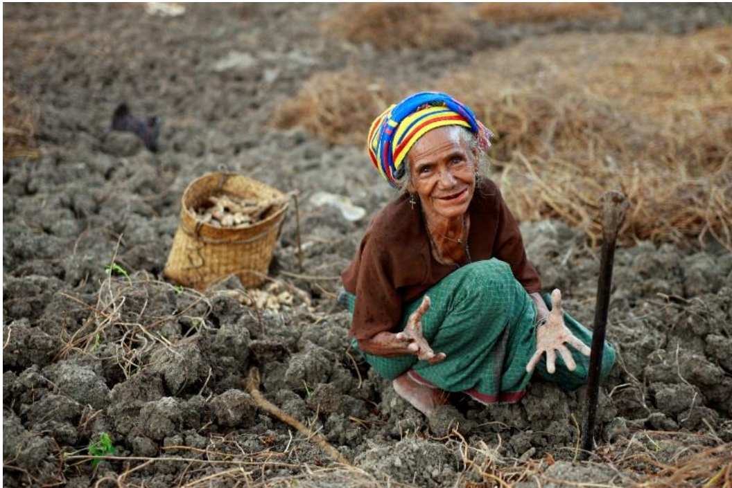
A local woman in Lesuata, Timor-Leste. A team from the UN Integrated Mission in Timor-Leste (UNMIT) visited the area to conduct interviews with the local population and speak with suco (village) chiefs. UNMIT staff conduct these types of visits two to three times a year, often going into villages inaccessible by car

Die Weltbank empfiehlt, dass das Land „seine Wirtschafts- und Einkommensquellen diversifiziert, die Qualität des Bildungs- und Gesundheitswesens erhöht und die Bevölkerung mit nützlichen Qualifikationen ausstattet.“ Dazu müsste eine Strategie verfolgt werden, zeitnah eine große Anzahl an Arbeitsplätzen zu schaffen. Die Berufsausbildung sollte den Absolventen dann einen leichten Einstieg in die produzierenden Gewerbe des Landes ermöglichen.