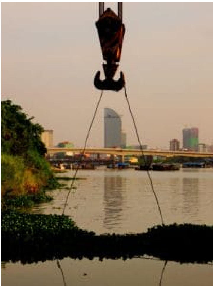
Blick auf Phnom Penh von einer Sandbaggerplattform im Mekong aus gesehen

Die Bürger*innen sind nicht passiv gegenüber den menschen- und umweltfeindlichen Folgen der unersättlichen privatwirtschaftlichen Entwicklung. Zivilgesellschaftliche Organisationen setzen sich dafür ein, das öffentliche und politische Bewusstsein für den Klimawandel zu stärken und die Ansprüche auf Zugang zu Land und den Erhalt der Lebensgrundlagen einzuklagen.