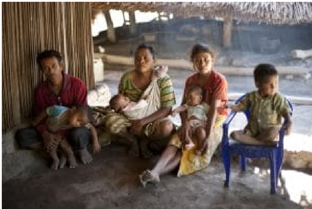
Dörfliches Leben an der Grenze zu Indonesien

Keine der großen Parteien, die bei der vorgezogenen Wahl am 12. Mai 2018 antraten, wird die Armutsbekämpfung im Land drastisch verbessern. Die FRETILIN hätte unter Alkatiris strikt reglementierter Führung die Elite noch exklusiver gefördert. Auch Xanana Gusmão und die CNRT werden die Ausbreitung der Korruption im Land nicht unterbinden. Ein wenig Hoffnung auf Veränderung bietet die neue Partei PLP um Expräsidenten Taur Matan Ruak mit seinem überwiegend jungen Team.