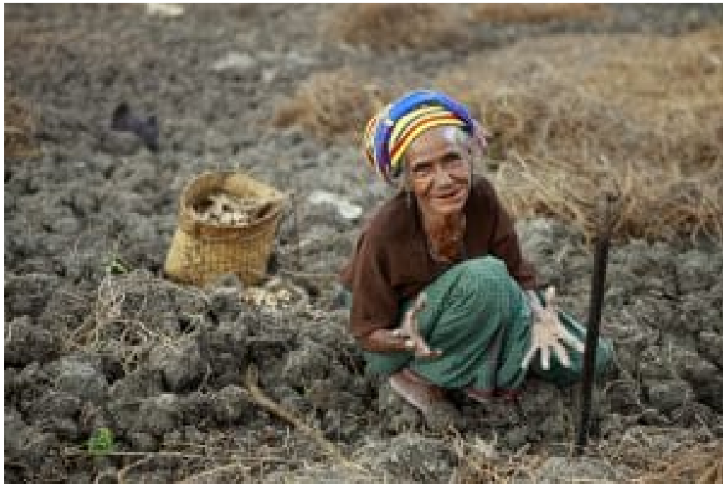
Landarbeiterin in Timor-Leste

Zur Verwaltung der Öl- und Gaseinnahmen richtete Timor-Leste kurz nach Erlangung seiner Unabhängigkeit von Indonesien 2002 einen Fond ein. Wie man mit den Erträgen umgehen soll, war von Anfang an umstritten: Sollten die Einkünfte für die Zukunft angelegt oder in aktuelle entwicklungsbedürftige Bereiche wie Bildung und Gesundheit, Ausbildung von Fachkräften etc. investiert werden? Obwohl also gesetzlich vorgeschrieben war, die Gewinne in den Fond einzuzahlen, konnte bis heute die Armut im Land mit diesen Einnahmen kaum gemildert werden.