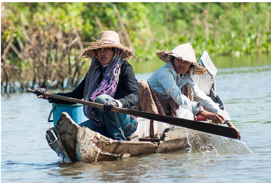
Frauen bei der Verrichtung körperlicher Arbeit in einem schwimmenden Dorf auf dem Tonle Sap Sees.

Die Frauenrechte in Kambodscha haben bedeutende Fortschritte gemacht. Mindestens 16 internationale Organisationen sowie lokale NGOs setzen sich aktiv für mehr Geschlechtergleichheit ein. Dennoch zeigt sich weiterhin ein starkes Gegenwirken durch strukturelle Diskriminierung und eine stereotype Vorstellung von Männlichkeit, sowohl innerhalb der Familie als auch in sozialen und wirtschaftlichen Strukturen.