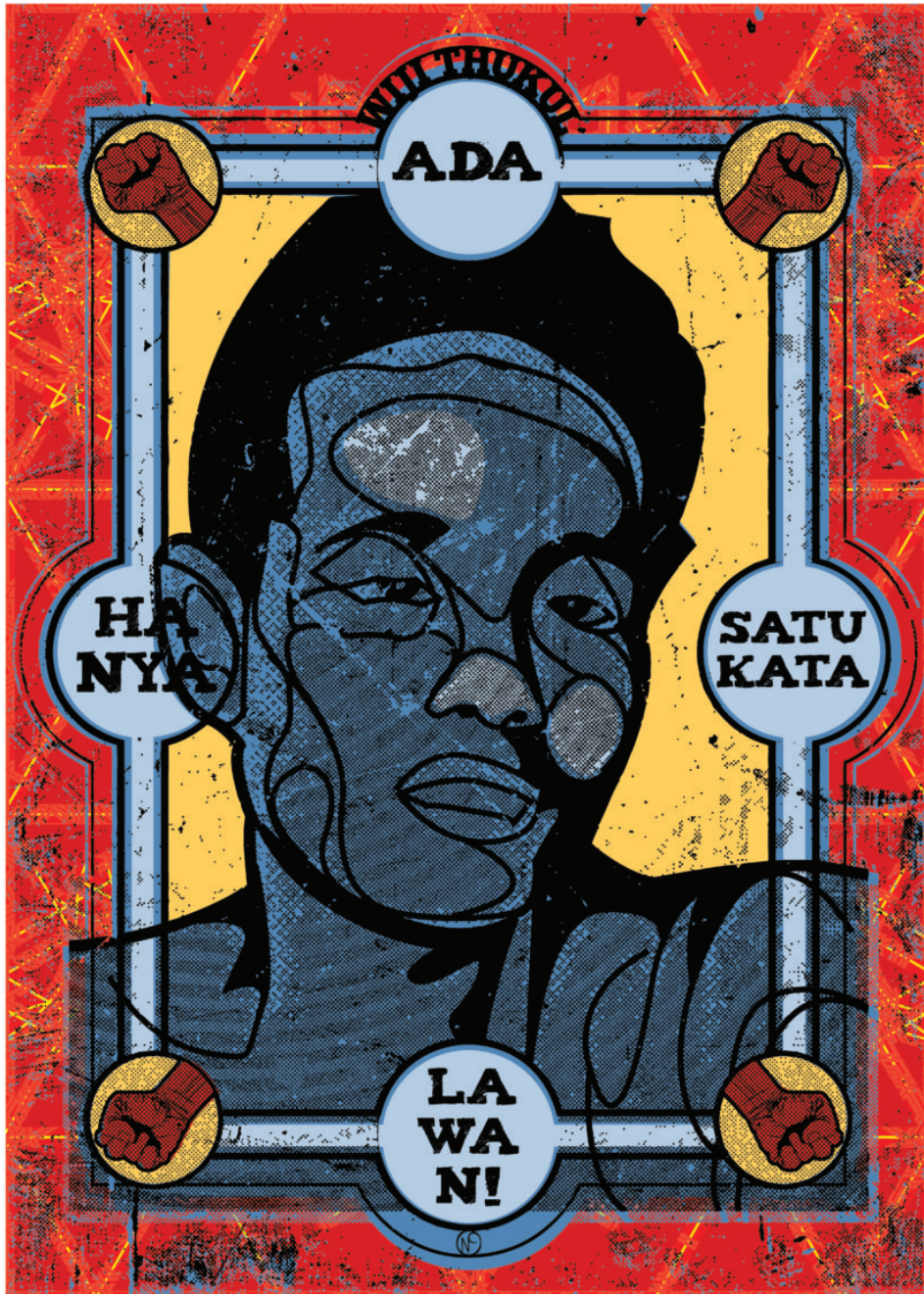
Poster des Künstlerkollektivs „Nobodycorp International“ mit dem berühmten Zitat des Poeten „Es gibt nur ein Wort: Widerstand“ © Nobodycorp

Endlich sind sie gesammelt auf Deutsch erschienen: die kraftvollen und zeitlosen Gedichte des seit 1998 verschwundenen indonesischen Lyrikers und Regimegegners Wiji Thukul. Beinahe prophetisch klingt sein Gedicht „ich schweife in der luft umher“ aus dem Jahr 1996: „in der luft könnt ihr nicht lügen, mit waffengewalt können radiowellen nicht mundtot gemacht werden [...] in der luft sprechen tausend stimmen/die könnt ihr nicht auf eine linie ausrichten/in dem moment wo ein gewehrschuss losgeht wird das echo bis in jeden winkel des kontinents getragen [...]“