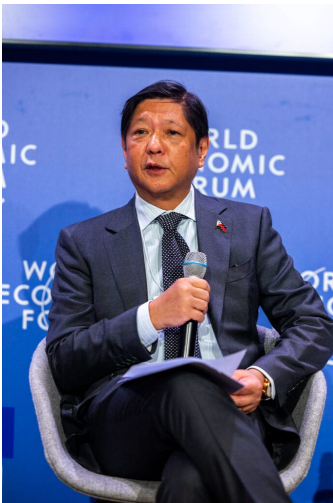
Präsident Ferdinand Marcos Jr. auf dem Weltwirtschaftstreffen 2023 in Davos, Schweiz.