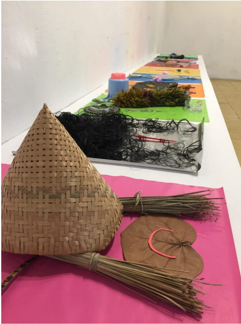
Assemblagen aus Objekten, die in Verbindung mit Geistern stehen