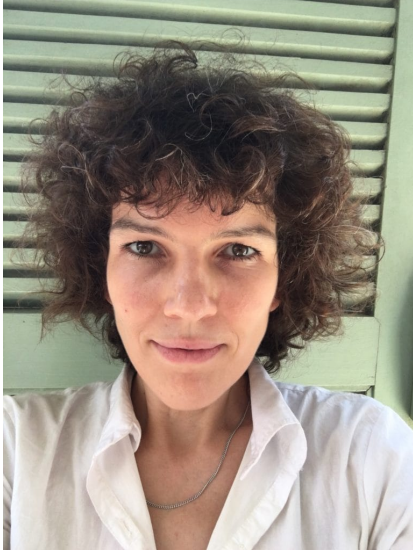
Katharina Duve © privat