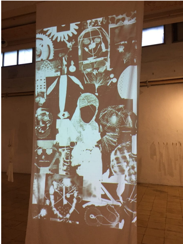
Fotocollage auf der Ausstellung „(Im)possible Identities – or how can we learn from ghosts?“