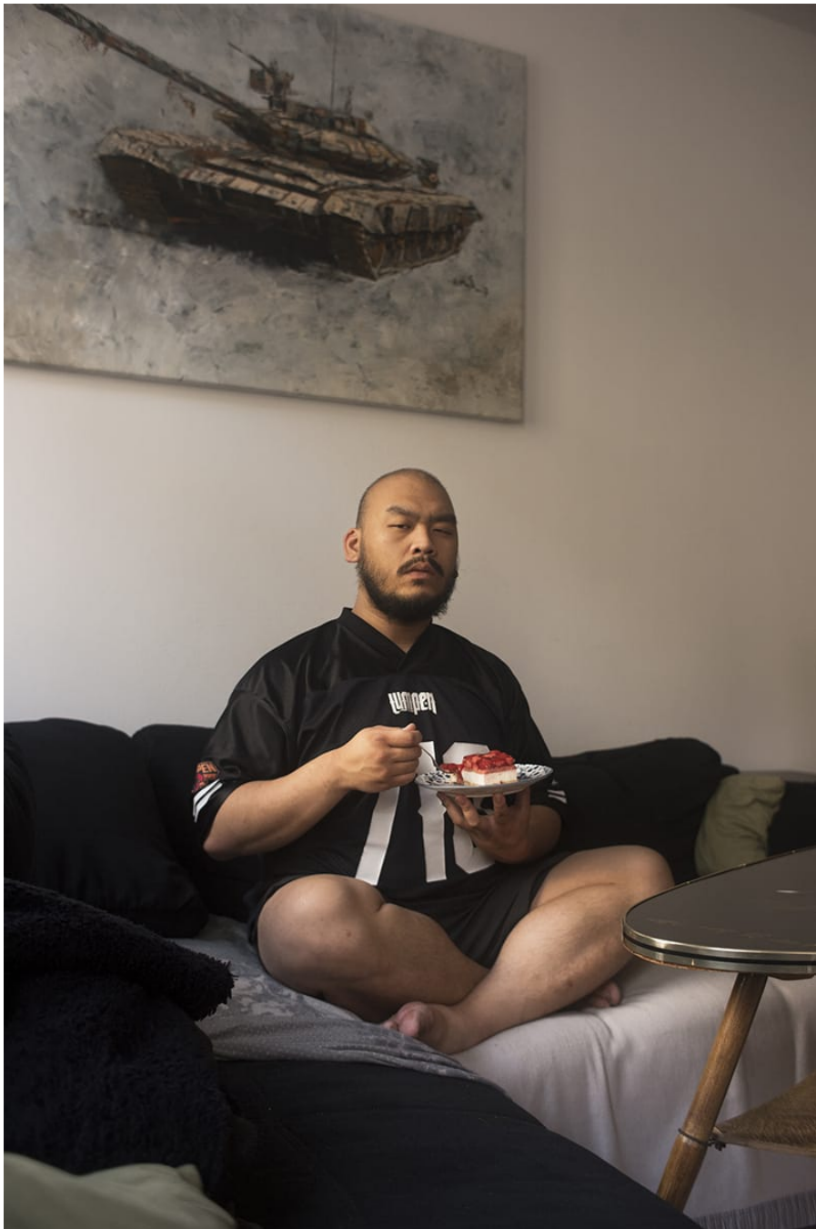
Foto aus der Bildstrecke „Wir, heute und hier“