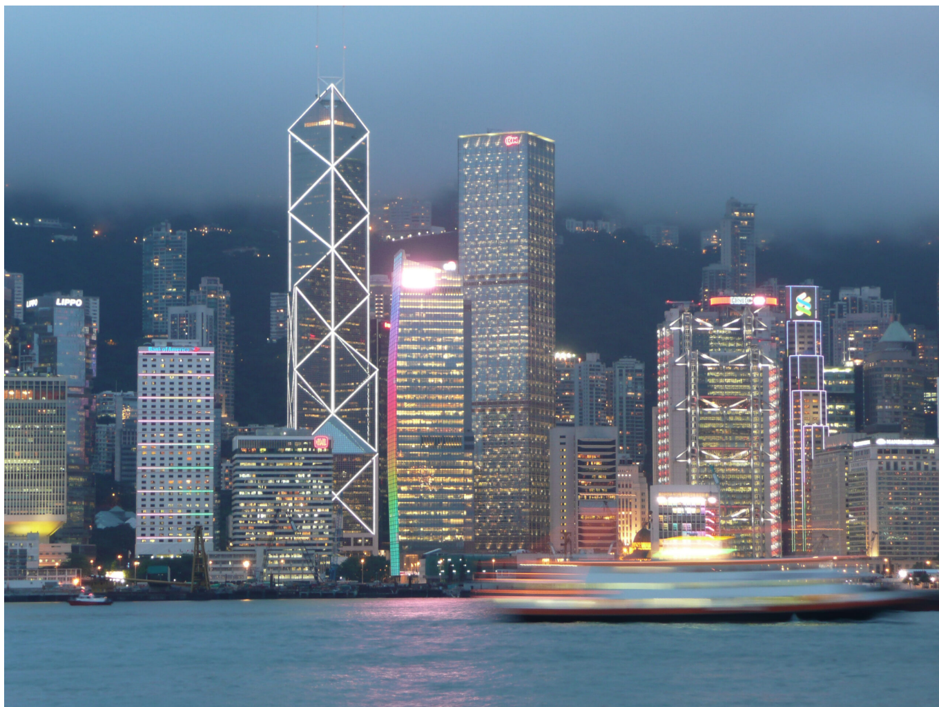
Finanzdrehscheibe: Hongkongs Banken Distrikt mit der Bank of China, Hongkong and Shanghai Banking Corporation und Standard Chartered Bank