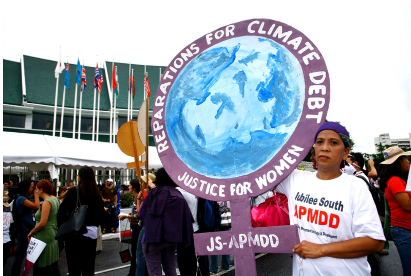
Zivilgesellschaftlicher Protest 2009 vor dem Gebäude der Vereinten Nationen in Bangkok

Wie in Deutschland auch, geht groß dimensionierte Infrastruktur häufig mit einem Abbau von Arbeitsplätzen am unteren Ende der Verdienstskaala einher: Die neue Brücke ersetzt die Fährleute, die Eisenbahn ersetzt die bislang kleinunternehmerisch organisierten Lkw-Fahrenden. Das heißt natürlich nicht, dass solche Investitionen grundsätzlich entwicklungsfeindlich wären – im Gegenteil. Die soziale Infrastruktur, die solche Arbeitsplatzverluste vorübergehend auffangen könnte, und die gezielte Schaffung neuer und moderner Arbeitsplätze auf der Grundlage der neu geschaffenen Infrastruktur sind aber im Regelfall nicht Teil der Projektfinanzierung. Vielmehr werden die Betroffenen sich selbst überlassen.