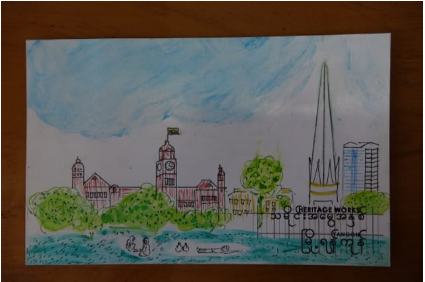
Gemaltes Bild des Hohen Gerichtshofs ( High Court ), mit Unabhängigkeitssäule © Felix Girke

„Ich malte dieses Bild vom Hohen Gerichtshof , dem historischen Erbe, um zu betonen, dass Gerechtigkeit einer der wichtigsten Pfeiler von Myanmar ist.“ (P54)