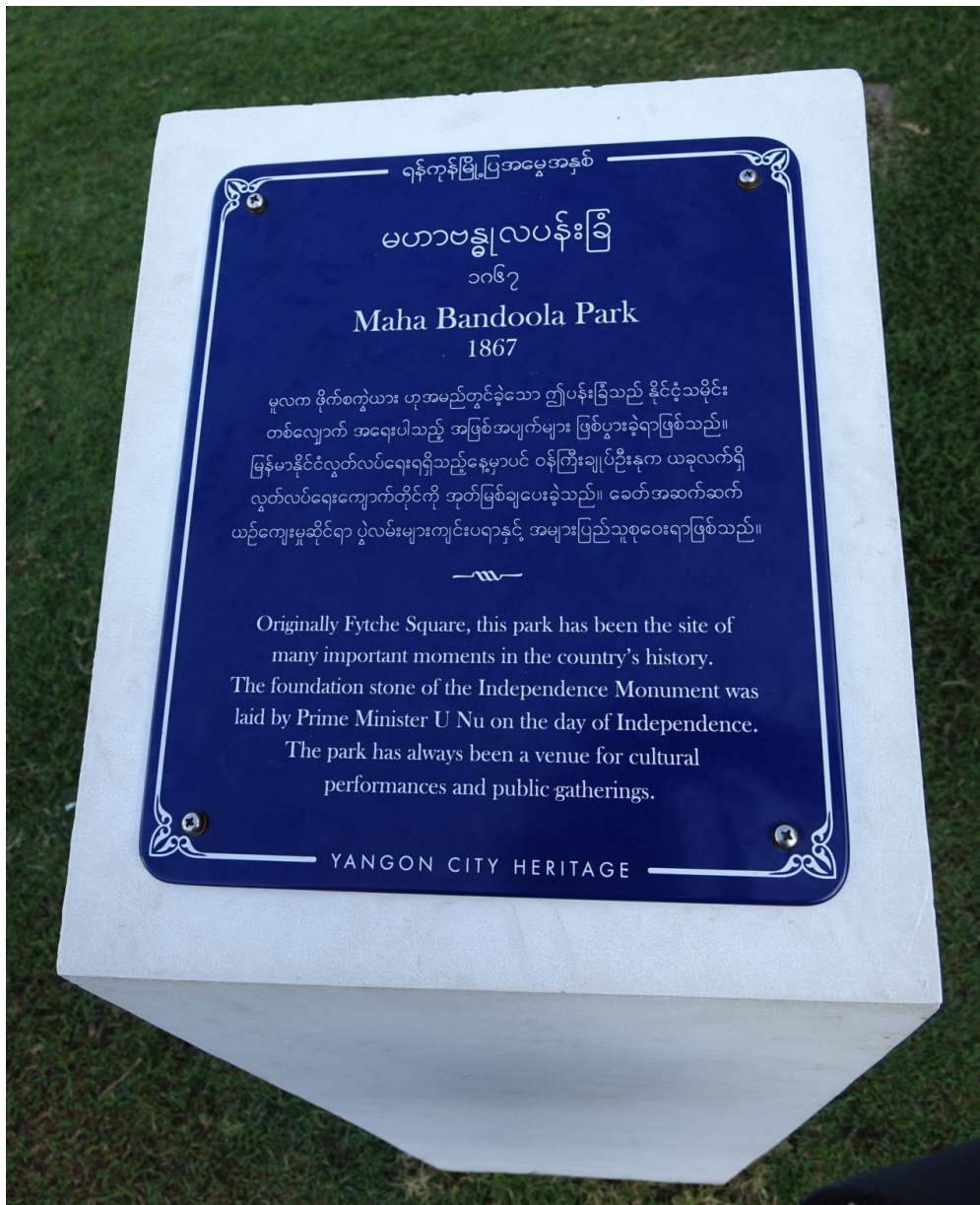
Blaue Plakette im Mahabandoola-Park

Doch die monumentalen Gebäude waren für die Stadtbevölkerung – abgesehen von der Bildungselite, die als Verwaltungskräfte und Politiker*innen dort ein- und ausgingen – keine wertvollen Erinnerungsorte. Die Bemühungen, mit der Unabhängigkeit 1948 eine neue nationale Identität zu gestalten, waren primär antikolonial und bezogen sich auf die Zeit der buddhistischen Königtümer. Über Jahrzehnte pflegte niemand die Wertschätzung kolonialer Architektur. Im Gegenteil: die urbane Bevölkerung wurde noch mehr von den Prachtbauten entfremdet, da diese (wenn auch widerwillig) von der ungeliebten Militärregierung genutzt wurden.