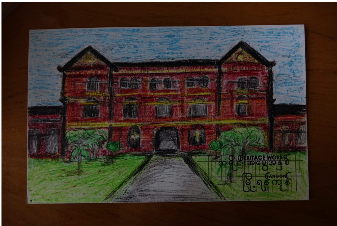
Bild des ‚Secretariat‘ in Yangon, erstellt im Rahmen von Heritage Works! (2015)

Myanmar: Yangons koloniale Architektur ist weltberühmt. Seit 2013 versuchen Organisationen, die lokale Bevölkerung für dieses zwiespältige Erbe zu sensibilisieren. Dafür braucht es jedoch mehr als einen elitären Diskurs.