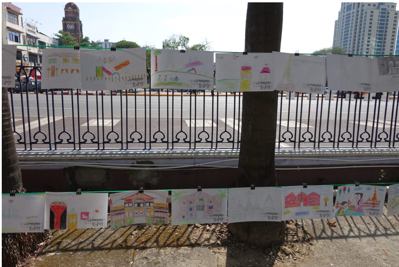
Installation der Postkarten vor dem Rathaus, mit High Court im Hintergrund (links)