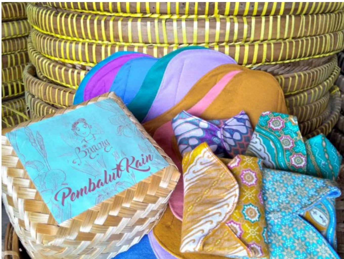
Monatsbinden aus Stoff