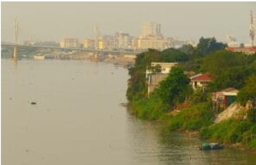
Der Tonle Sap bei Phnom Penh.

Auch die Staudämme der Wasserkraftwerke am Lauf des Mekong - vor allem in China, wo der Fluss Lancang genannt wird - und seiner Nebenarme beeinflussen das Ökosystem Tonle Sap stark. Sie verhindern nicht nur die Fischwanderung, sondern ändern auch die Wassermengen, da sie am Oberlauf in China große Mengen Wasser zurückhalten und so den natürlichen Wasserkreislauf unterbrechen.