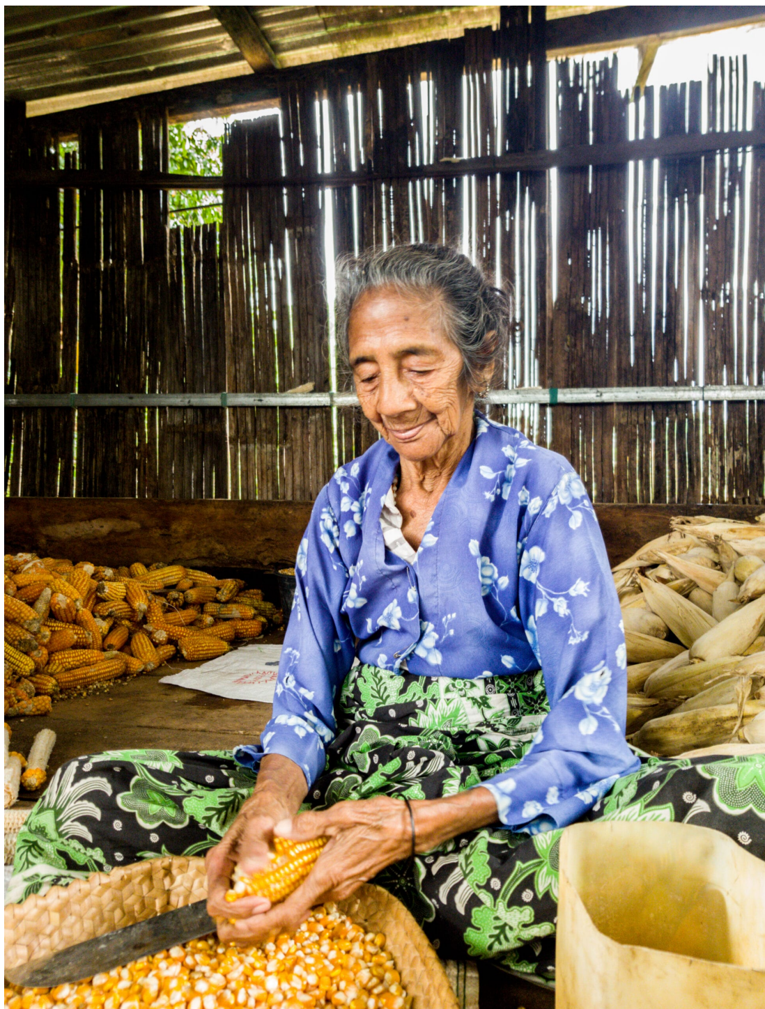
Frauen sorgen für die Ernährung

Wir sollten den Mut und die Kraft der Frauen in den ländlichen Gebieten wieder ins Bewusstsein rücken. Das Wissen über Land, Nahrung, Ernährung, Naturkräutermedizin, Kleidung muss erhalten bleiben. Im Jahr 1975 gelang es der von Frauen geführten Volksbewegung OPMT, der Rosa Muki Bonaparte angehörte, die Analphabetenrate stark zu verbessern. Kinderkrippen und öffentliche Kinderbetreuung sollten zu mehr Gleichberechtigung von Frauen und Männern im Haushalt führen. Wir müssten wieder eine solche Bewegung mobilisieren.