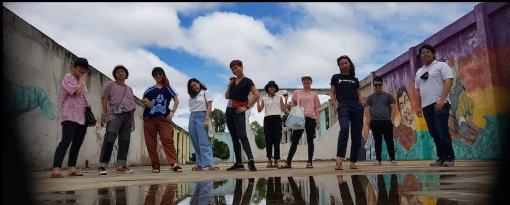
Internship and capacity program for college students.

Aktivist*innen bei thaiconsent gehören zur neuen, feministischen Generation in Thailand