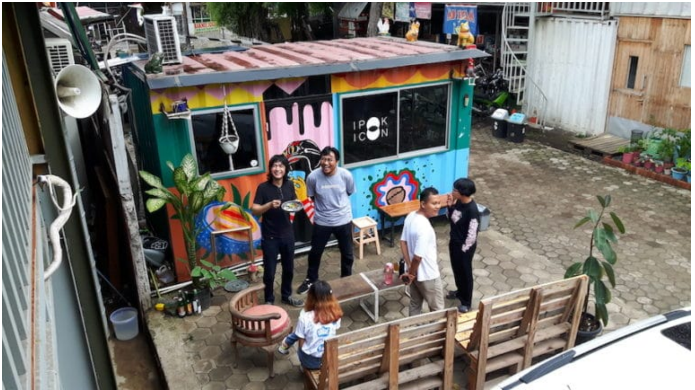
Die Journalistin Christina Schott stellt das kuratorische Konzept vor, mit dem das Kollektiv ruangrupa die documenta fifteen gestaltet. Leitprinzip ist lumbung - der gemeinsam verwaltete indonesische Reisspeicher.