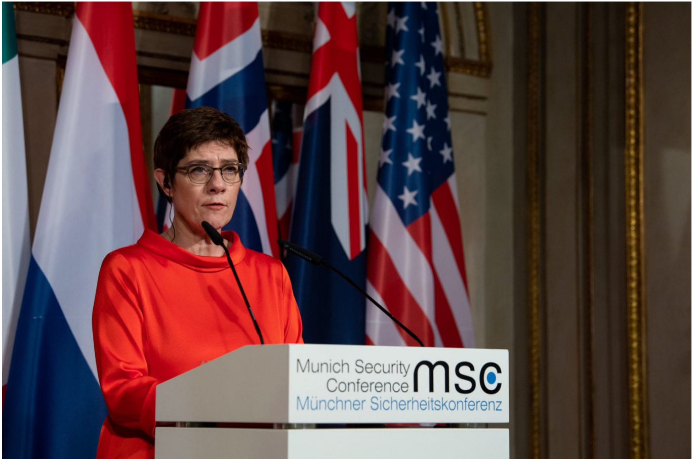
Verteidigungsministerin Annegret Kramp-Karrenbauer bei der Münchner Sicherheitskonferenz 2020

und global agierende Terror-Organisationen, Piraterie, organisierte Kriminalität, die Auswirkungen von Naturkatastrophen sowie Migrationsbewegungen. Gerade die zuletzt genannten Aspekte, die eher zu den nicht-traditionellen Sicherheitsbedrohungen zählen, stehen bei den Anrainern des Indo-Pazifiks weit oben auf der sicherheitspolitischen Agenda. Das breite Spektrum an sicherheitspolitischen Bedrohungen steht in einem offensichtlichen Spannungsverhältnis zu der Bedeutung des Indo-Pazifiks für globale Warenströme.