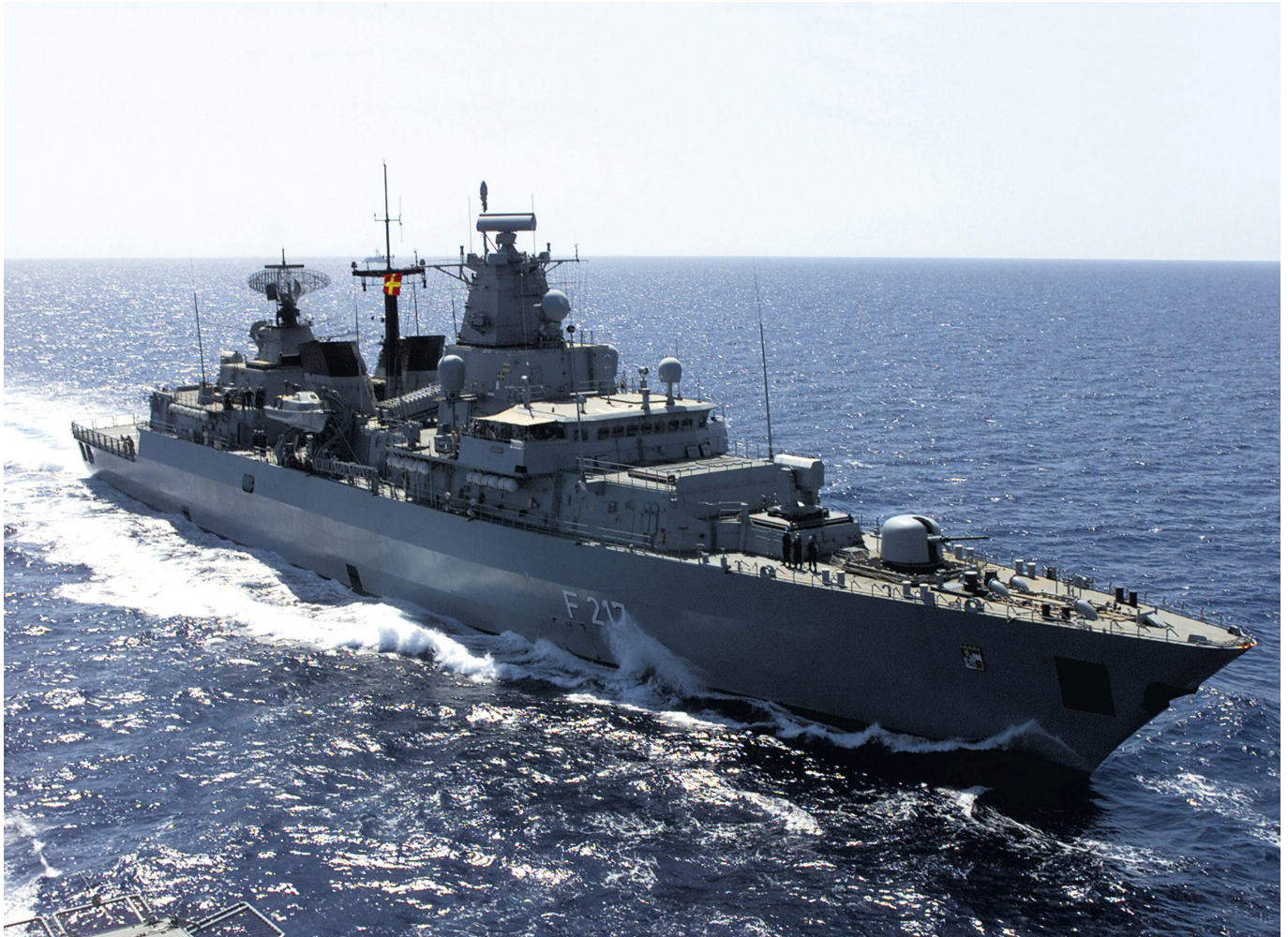
Die Fregatte Bayern während der Operation Enduring Freedom

Anforderungen der jüngst herausgegebenen Leitlinien für den Indo-Pazifik: „Wir werden Flagge zeigen für unsere Werte, Interessen und Partner“. Anfang März 2021 veröffentlichten dann das Auswärtige Amt und das Bundesministerium für Verteidigung konkrete Details zu der anstehenden Fahrt der Fregatte. Ab August soll diese ihre etwa sechsmonatige Reise antreten, dabei mehr als ein Dutzend Hafenbesuche zwischen dem Horn von Afrika, Australien und Japan im Indo-Pazifik absolvieren. Operativer Höhepunkt der Tour soll die etwa dreiwöchige Teilnahme an den VN-Sanktionsmaßnahmen gegenüber Nordkorea darstellen.