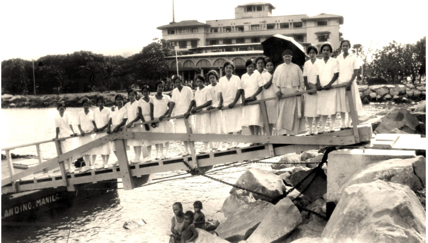
Filipina student nurses. A halt in the morning walk. Manila Hotel in background, Manila, Philippines

Krankenschwester in Manila ca. 1930. Heute arbeiten viele Filipin@s in den deutschen „Krankenhausfabriken“.