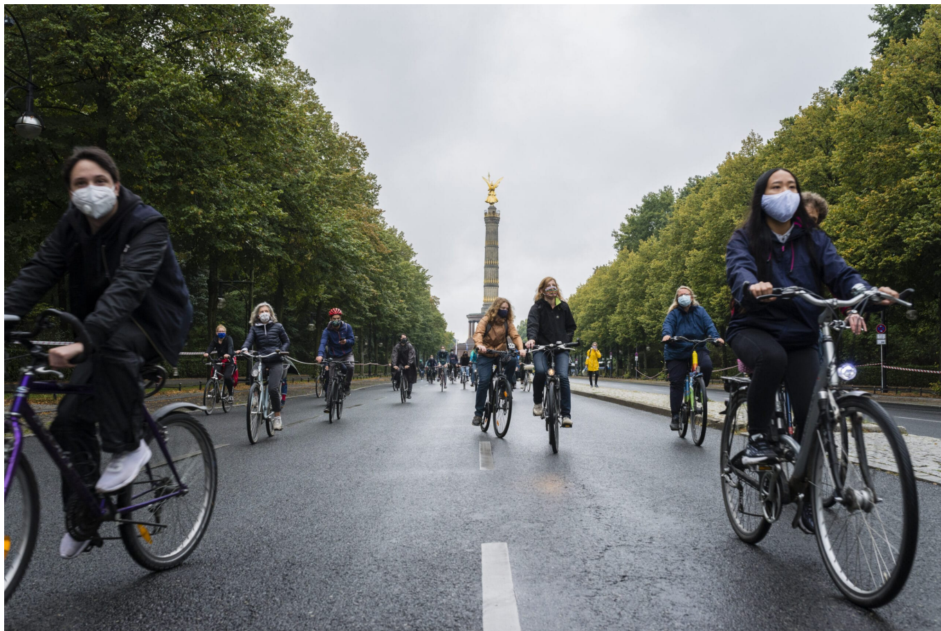
Klimaproteste im Lockdown, Berlin 2021

Das Unvermögen der Regierung gekoppelt mit der kalten Verwertungslogik des Kapitals wird in der Pandemie auf besondere Weise im Gesundheitssektor sichtbar. Die Autor*innen sprechen von der „Durchrationalisierung des Krankenhausesektors zur Fabrik“. Der „radikale Abbau der Krankenhauskapazitäten“, Pflegenotstand und Kostensenkung durch die schlechte Bezahlung von migrantischem Pflegepersonal, zum Beispiel aus den Philippinen, hätten dazu geführt, dass die Situation für Beschäftigte im Gesundheitsdienst schon vor der Pandemie unerträglich gewesen sei. Die Blockadehaltung der EU bezüglich der Freigabe der Patente auf Covid-19-Impfstoffe nehme den unnötigen Tod von Hunderttausenden Menschen vor allem im Globalen Süden in Kauf.