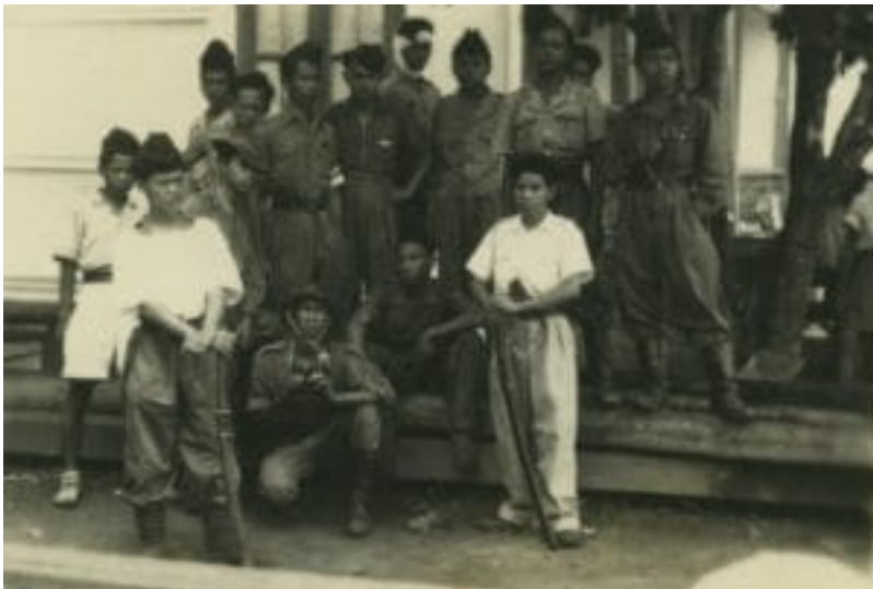
Beschlagnahmtes Gruppenfoto von Soldaten der Streitkräfte der Indonesischen Republik (TRI, 1946-1947) Nachfolgerin der Volkssicherheitsarmee und Vorgängerin der Indonesischen Nationalen Armee (TNI).

Die Ordnung ‚auf dem Schiff‘ war, schreibt der Autor, ausgesprochen hierarchisch, aber nicht völlig statisch. Ein begrenztes Maß an sozialer Mobilität war möglich, freilich ging es abwärts am schnellsten, während Aufstiegschancen minimal blieben, sich im Zuge der Weltwirtschaftskrise sogar noch verringerten. „Die Leitern zu den höheren Decks verrosteten oder wurden sogar abgebaut. Die Ordnung konnte nur noch durch Repression aufrechterhalten werden.“