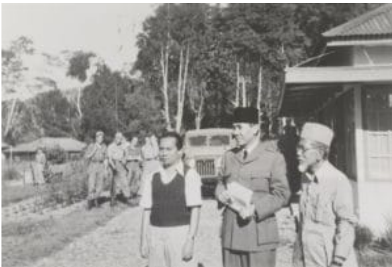
Sutan Sjahrir, Sukarno und Hadji Agus Salim als Gefangene während der ‚Zweiten Polizeiaktion‘. 19.12.1948

Nach dem Abwurf der amerikanischen Atombomben auf Hiroshima und Nagasaki kapitulierte Japan am 15. August 1945. Nur zwei Tage später verlas Sukarno, an der Seite von Mohammad Hatta, einem weiteren Veteranen der antikolonialen Bewegung, die Proklamasi , die Unabhängigkeitserklärung. Doch es sollten noch viereinhalb Jahre vergehen, bis das Land die koloniale Fremdherrschaft formal abschütteln konnte. Die Niederlande waren keineswegs gewillt, ihre Macht aufzugeben. Auch andere Staaten mischten kräftig mit, Großbritannien zunächst, später vor allem die Vereinigten Staaten. Am Ende war es nicht zuletzt der Druck aus Washington, der die Niederlande dazu brachte, klein beizugeben.