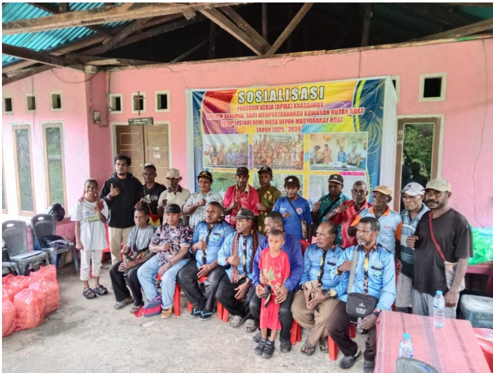
Treffen der indigenen Gemeinschaft der Knasimos zum Thema Waldschutz durch Ökotourismus.

Die Knasimos erkennen, dass der Schutz ihres angestammten Landes heute nicht mehr allein auf traditionellem Wissen beruhen kann. Dieses Wissen muss in eine Sprache übersetzt werden, die für staatliche Bürokratien verständlich ist. Daher stellt die Kartierung ihrer traditionellen Territorien einen entscheidenden Schritt dar. Gemeinsam mit unterstützenden Organisationen kartierten sie vierzehn Clangebiete. Der Prozess war partizipativ und bezog alle ein, einschließlich junger Menschen. Obwohl zeit- und kostenintensiv, wird er als langfristige Investition betrachtet.