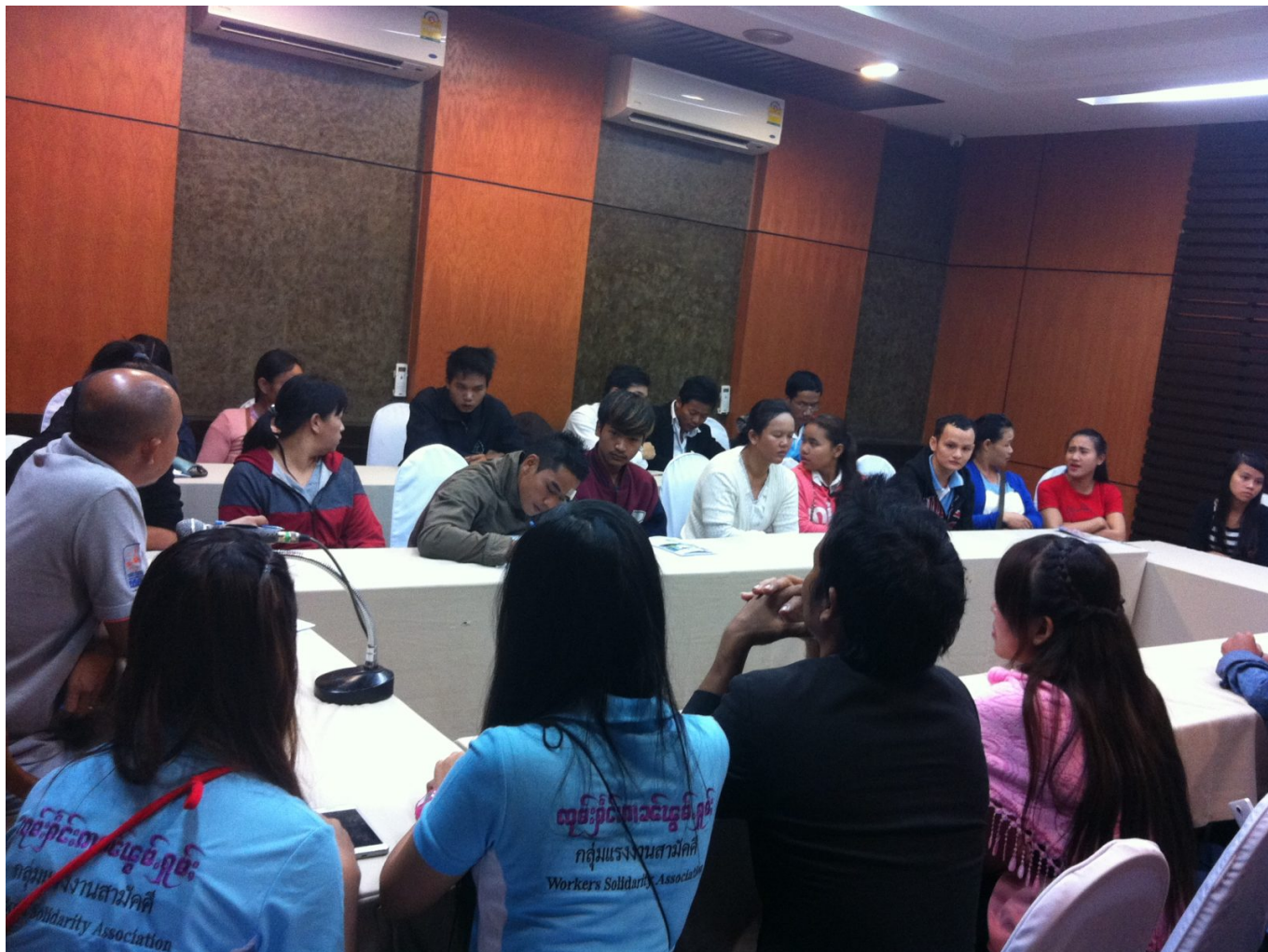
Mitglieder der „Gruppe der Hausangestellten“ nehmen an einem Seminar über die globale Situation von Hausangestellten teil

Thailand: Nach dem Gesetz haben Arbeitsmigrant*innen seit 1998 die gleichen Rechte wie thailändische Arbeiter*innen. Die Realität sieht anders aus. Gerade Haushaltsangestellte( แม่บ้าน) werden bei Löhnen, sozialer Absicherung, Urlaub, Arbeits- und Freizeit benachteiligt und auch anders diskriminiert. Die transnationale Organisierung von Haushaltsangestellten trägt aber erste Früchte.