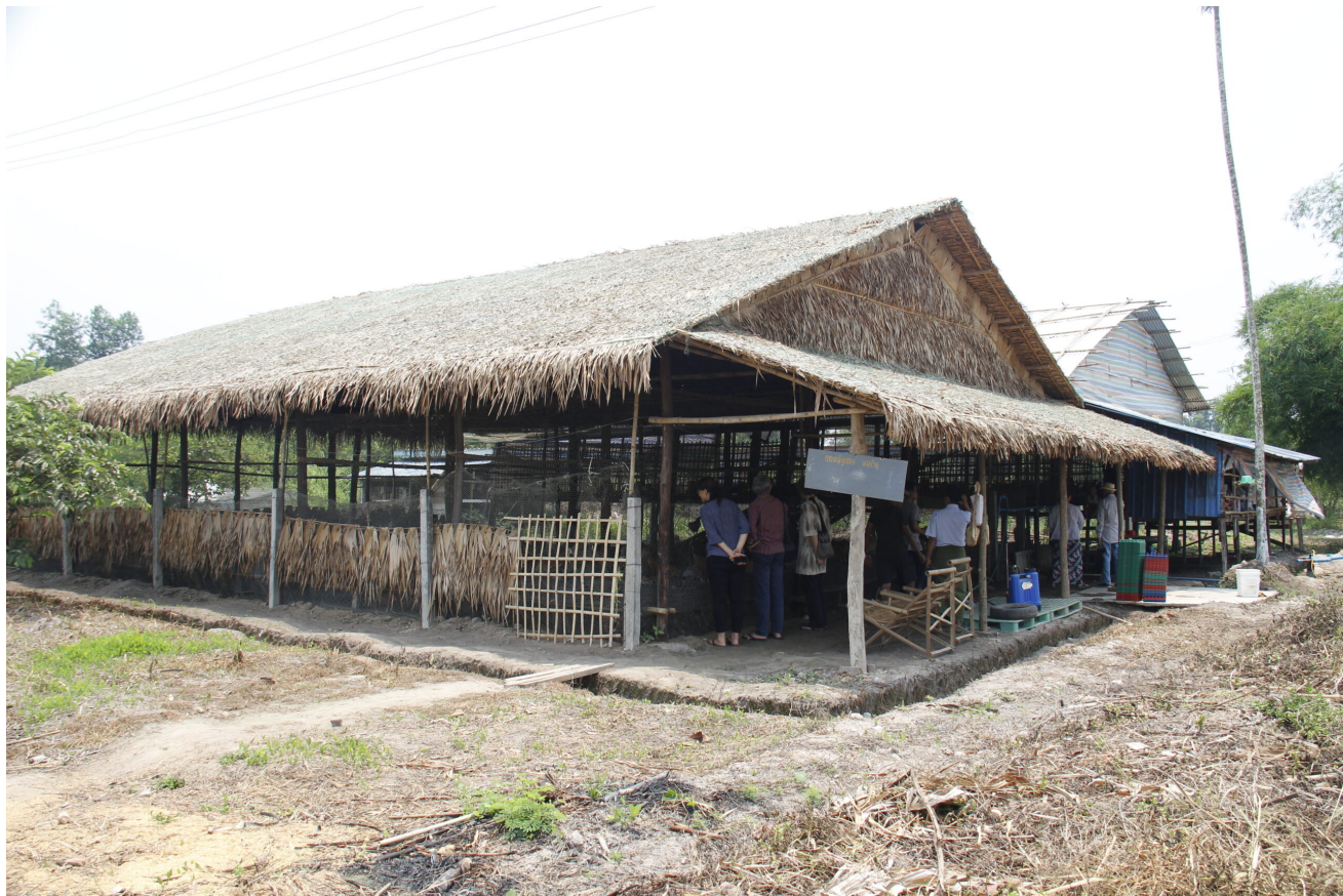
Hühnerstall der Healthy Egg Production Group in der Nähe von Yangon

Unter solchen Bedingungen entstehen und verbreiten sich schnell Krankheiten, die rasch zu einer oft lang anhaltenden Verminderung der Legeleistung führen. Um dem vorzubeugen, aber auch um entstandene Krankheiten effektiv zu bekämpfen, werden in großem Maße Antibiotika eingesetzt.