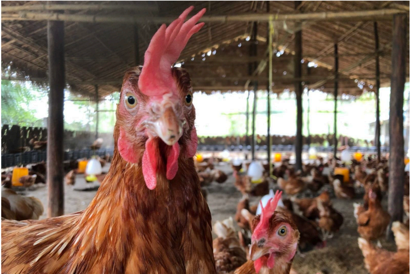
Dieses Huhn legt Eier ohne den Einsatz von Antibiotika

Myanmar: Eine Gruppe Hühnerfarmer*innen in Myanmar setzt auf alternative Produktionsbedingungen und vermarktet Eier ohne den Einsatz von Antibiotika.