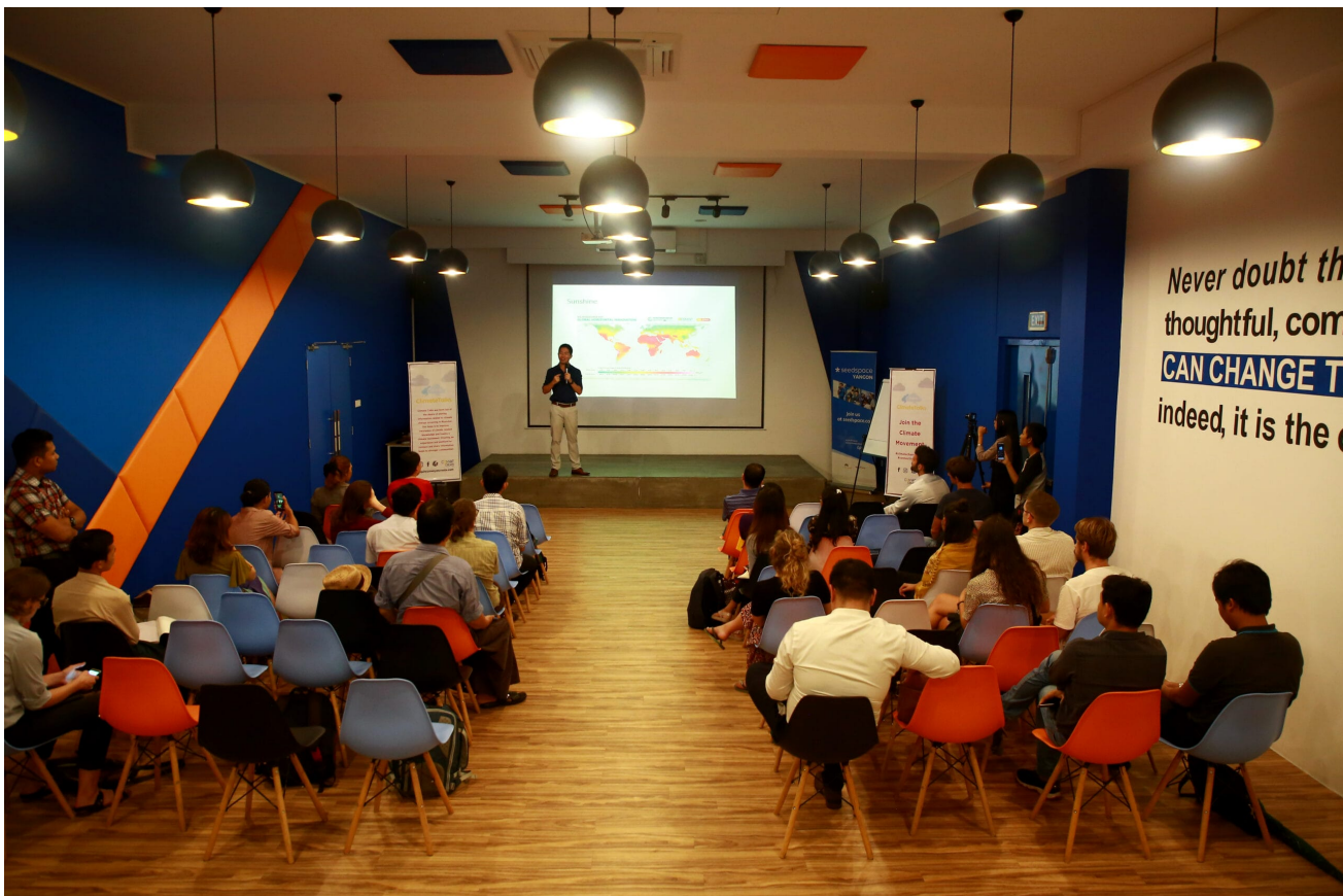
Eindrücke von einem Climate Talk, Veranstaltungsort Seedspace, Yangon 2019

Nicole: Es ist Teil unserer Unternehmenskultur, dass wir verschiedene Kulturen und Sprachen respektieren. Unser Büro ist ein Open Space. Je mehr Leute sich einbringen können, desto besser kann das Ergebnis werden - vor allem, wenn man Leute mit fundierten lokalen Kenntnissen hat, aber auch Leute, die Erfahrung mit der Arbeit auf globaler Ebene haben. Durch die Freiwilligen hören wir die Stimmen der Jugend. Myanmar hat eine lange Kultur mit strengen Hierarchien hinsichtlich Alter und Geschlecht. Diese Art von Arbeitskultur bricht das auf. Das Conyat -Team selbst besteht hauptsächlich aus Frauen. Und viele der Freiwilligen sind ebenfalls Frauen.