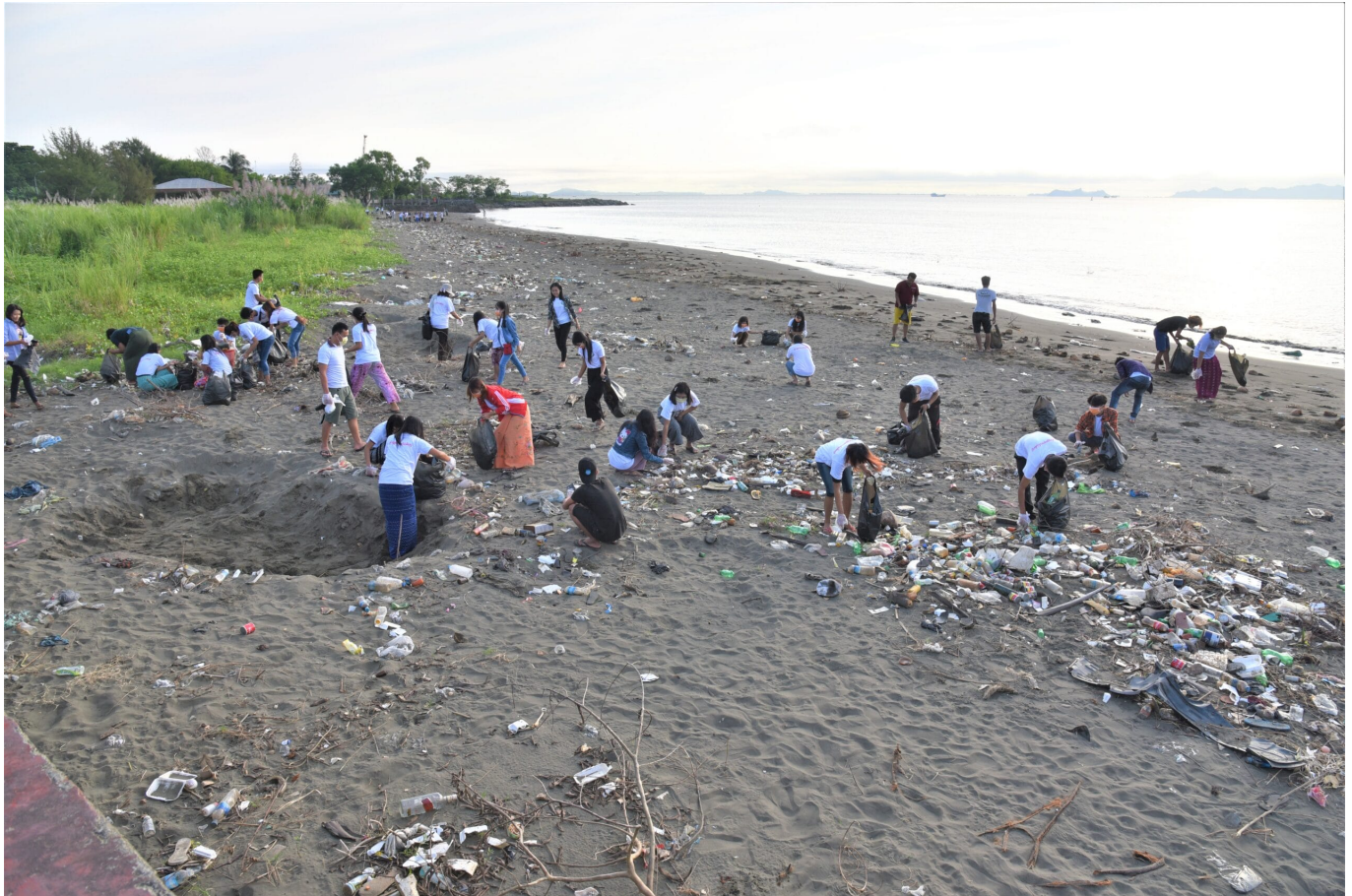
Studierende säubern den Strand von Plastikmüll in Sittwe im Rakhine Staat

Der Privatsektor spielt eine große Rolle, aber auch die Politik. Die ethnischen Staaten Myanmars, die besonders anfällig für die Auswirkungen des Klimawandels sind, sind auch politisch umkämpft. Wie kann man Eurer Meinung nach hier effektiv gegen den Klimawandel vorgehen und Klimaschutzmaßnahmen umsetzen?