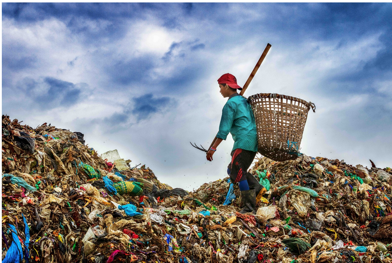
Müllsammler in der Insein Deponie