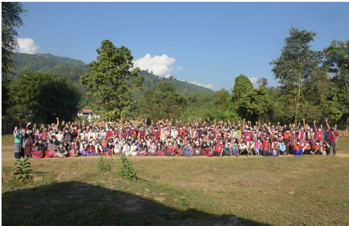
Die Generalversammlung des Salween Friedenspark

Darüber hinaus gründeten lokale Führungskräfte und Karen-Gemeinschaftsorganisationen das Covid-19-Notfallkomitee, um die Gemeinschaft in Mutraw zu schützen. Das Komitee organisierte die Ausbildung des lokalen Gesundheitspersonals, öffentliche Aufklärungskampagnen, Sicherheitsvorkehrungen in Schulen, die Einrichtung von medizinischen Kontrollpunkten und Quarantänezentren für Rückkehrer*innen. Durch Verbindungen zu Gesundheits- und medizinischen Organisationen an der thailändischen Grenze können Covid-19-Tests zur Analyse in ein Labor geschickt werden und Sauerstoff steht bei Bedarf zur Verfügung. Auf diese Weise wird die Kommunikation mit der Weltgesundheitsorganisation und dem öffentlichen Gesundheitssystem in Thailand aufrechterhalten. Das Komitee half auch dabei, den Zugang zu Lebensmitteln sicherzustellen, zum Beispiel durch Reisvorräte und Verteilungspläne. Durch die Verbindung indigener Praktiken mit modernen medizinischen Verfahren hat Mutraw eine koordinierte, gut organisierte und effektive Reaktion geschaffen, die die Pandemie weitgehend unter Kontrolle gebracht hat und die Gemeinden vor einer ernsthaften Knappheit an Lebensmitteln schützt.