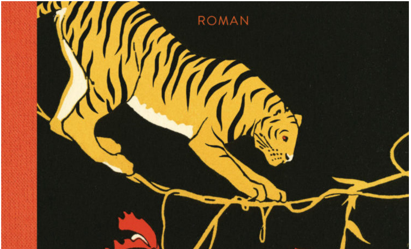
Buchcover-Ausschnitt „Nachttiger“ von Yangsze Choo

Malaysia: Der Roman „Nachttiger“ spielt in British-Malaya und führt tief in die multiethnische Gesellschaft unter britischer Kolonialherrschaft. Auf der Suche eines Jungen nach einem verlorenen Finger kommt es zu merkwürdigen Todesfällen. War es ein Tiger? Oder doch ein Geisterwesen?