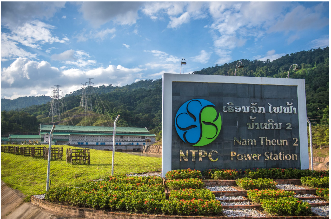
Stromerzeugung für den energiehungrigen Nachbarn Thailand

Er bezweifelt, dass Wasserkraft eine zukunftsfähige Energiequelle ist. Wasserkraft ist aus ökonomischer Sicht ein Verlustgeschäft, weil die Entscheidungen bei den Kostenberechnungen meistens einseitig getroffen werden und Faktoren wie Inflation, Schuldentrückzahlung und ökologische und soziale Kosten nicht einbezogen sind.