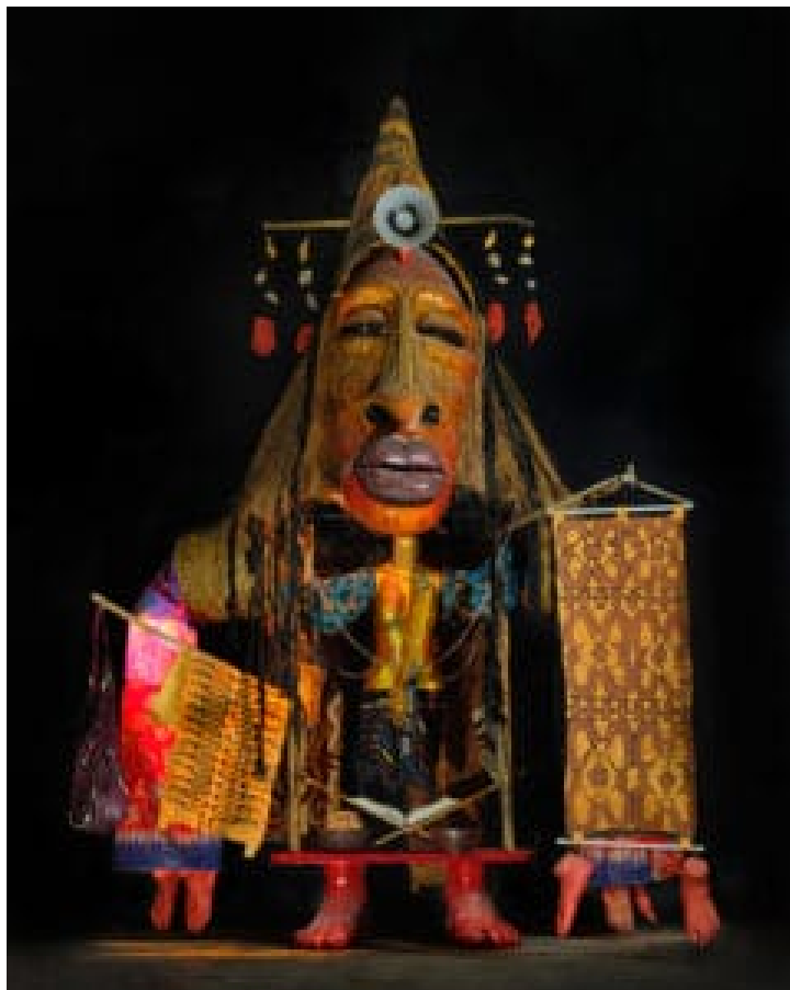
A Little Gate to Koreri , 2023, Dicky Takndare - Mixed Media.

Koreri entstand einst als messianische Bewegung in der Region um Biak im Norden des Landes. Als Ursprung gelten Schilderungen zu einer Ahnengestalt namens Manarmakeri , der nachgesagt wurde, zu wissen wie die Menschen ‚glücklich bis ans Ende ihrer Tage‘ leben können. Doch ihre Weisheiten und die Predigten von Anhängern wurden nicht ernst genommen und so reiste das sagemumwobene Wesen verärgert ab, das Geheimnis von Koreri mit sich nehmend. Es soll jedoch dem Volk von Biak versprochen haben, zurückzukehren, um Unabhängigkeit, Wohlstand und ein neues Leben zu bringen.