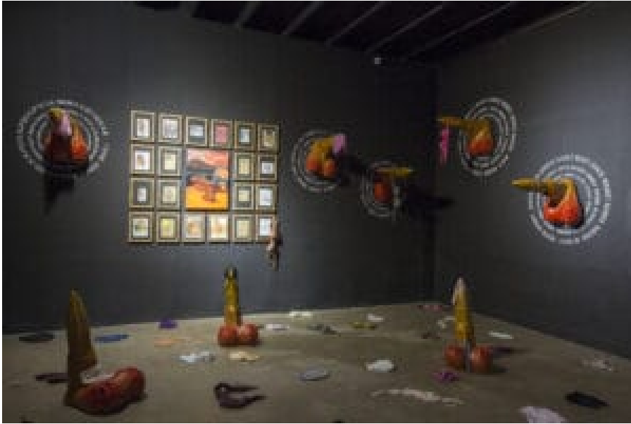
Betty Adii: Dystopian Reality: The Agony of Existence , 2021 raumgroße Installation. © Courtesy of the Artists

bekommen. Aus Scham und Angst sprechen viele Opfer nicht über die an ihnen begangene Gewalt.