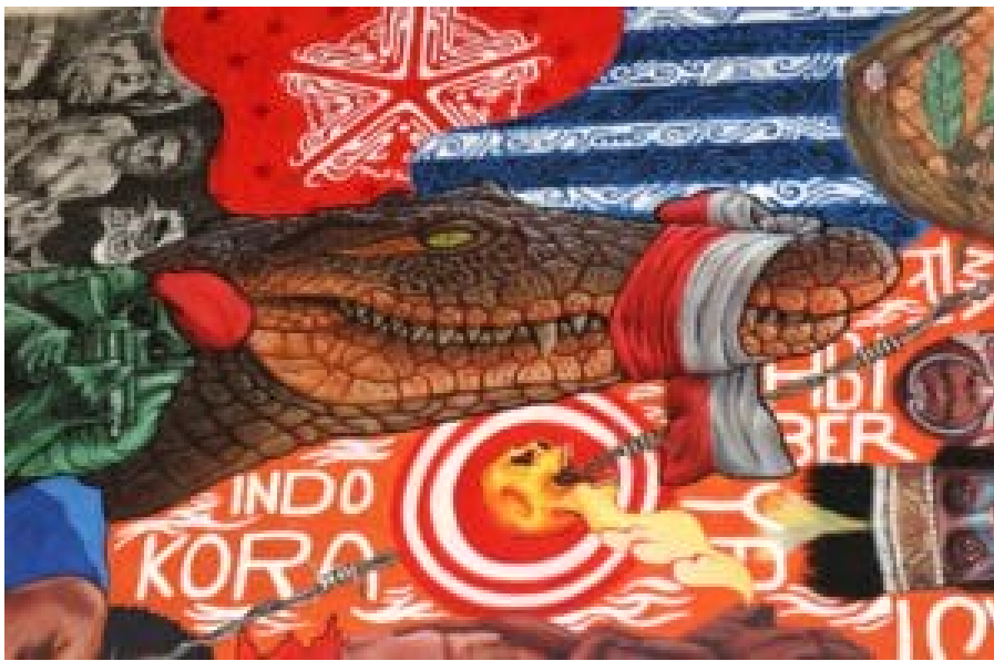
The Timako Woo Chronicle (Ausschnitt), 2023. © Marion Struck-Garbe

Udeido hat Anschauungen wie diese aufgenommen. Ähnlichkeiten zwischen Krokodilen und den indigenen Völkern Papuas bestehen ihres Erachtens tatsächlich: beide werden gejagt und müssen sich verstecken. Die Morgensternflagge am oberen Bildrand bezieht sich explizit auf eine Episode des Mythos um Manarmakeri . Die Fahne wurde erstmals 1942 gehisst, während eines Koreri -Aufstands zur Zeit der japanischen Invasion und des Zusammenbruchs des niederländischen Kolonialregimes. Seitdem repräsentiert sie den Traum von Unabhängigkeit, Freiheit und Frieden. Sie symbolisiert den Widerstand schlechthin. Das öffentliche Zeigen der Morgensternflagge ist heute überall in Indonesien verboten und kann mit bis zu 15 Jahren Haft bestraft werden.