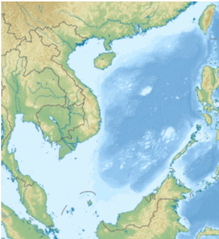
Reliefkarte Südostasiens mit dem Südchinesischen Meer im Zentrum

Die Fischereirechte der Anrainerstaaten sind umstritten. Insbesondere stimmt die Auslegung der 200-Meilen-Wirtschaftszone nicht mit dem 1994 in Kraft getretenen UN-Seerechtsübereinkommen überein bzw. wird nicht anerkannt.