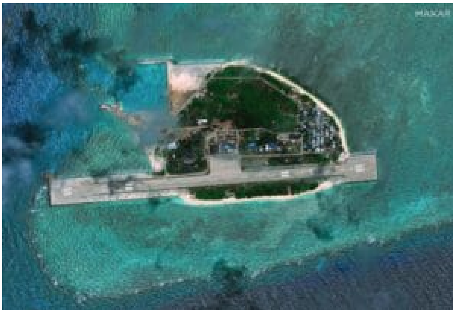
Thitu Island (Pulo ng Pag-asa) mit philippinischem Militärstützpunkt im August 2024

Die Philippinen haben die längste Küste am Südchinesischen Meer. Von den Spratly-Inseln haben sie neun besetzt. Der größte Militärstützpunkt ist das 430 Kilometer von Palawan und lediglich 25 Kilometer vom chinesischen Militärstützpunkt Subi-Riff entfernte Thitu Island mit einem 1.300 Meter langen Flugplatz. Von dort sind drei weitere Inseln (Loaita Island 45 Kilometer südlich, Northeast Cay 45 Kilometer nördlich und Nanshan Island 170 Kilometer östlich) ebenfalls vom Militär besetzt. Das mit zwölf Marinesoldaten besetzte, an der Second Thomas Shoal auf Grund gesetzte Marine-Landungsboot Sierra Madre liegt auf etwa der Hälfte der Strecke 200 Kilometer westlich zwischen Palawan und Thitu Island.