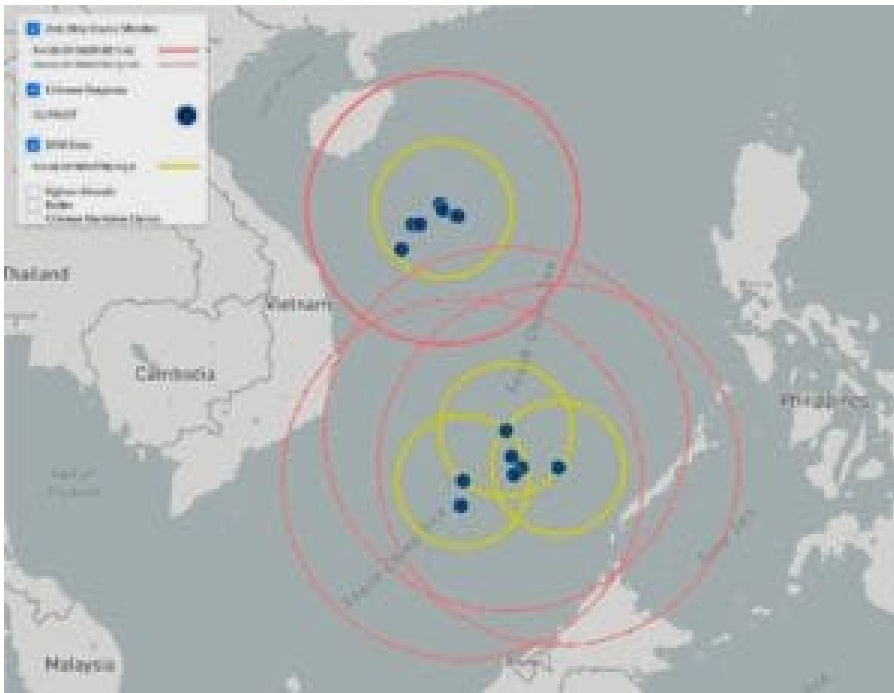
Chinesische Vorposten im umstrittenen Gebiet des Südchinesischen Meeres.

Taiwan hat eine Insel der Spratly-Gruppe - Itu Aba oder Taiping-Insel - 1.500 km südlich vom eigenen Staatsgebiet besetzt. Mit 1.300 m Länge und 365 m Breite besteht sie praktisch aus einer Landebahn mit einigen Wohnhäusern für Angehörige der Küstenwacht und einige wenige Zivilisten. Wie die Volksrepublik China beansprucht Taiwan (Republic of China) die Paracel- sowie die Spratly-Inseln.