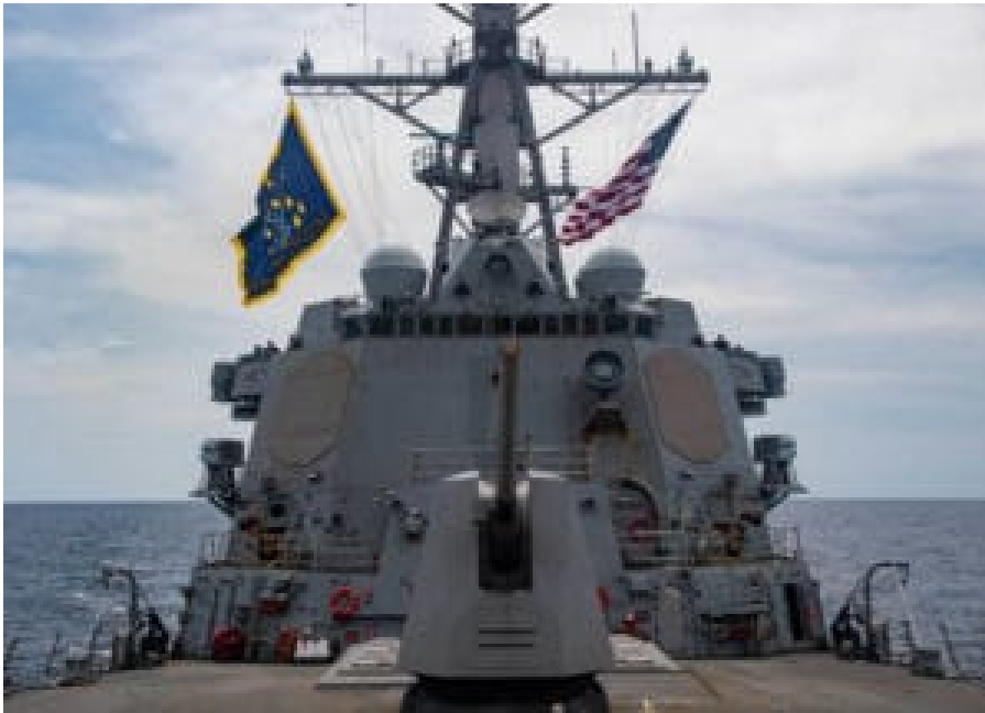
USS Mustin nahe den Paracel-Inseln im Südchinesischen Meer 2020

Die Analyse Southeast Asian Military Powers Ranked (2025) von Globalfirepower sieht Indonesien in der Rangliste an erster Stelle in Südostasien (15. weltweit), gefolgt von Vietnam (23.), Thailand (25.), Singapur (29.), den Philippinen (41.), Malaysia (42.) und Kambodscha (95.). Zum Vergleich: Deutschland belegt weltweit Rang 14. Weitere Daten für die Länder Südostasiens finden sich auf der Webseite von Globalfirepower.