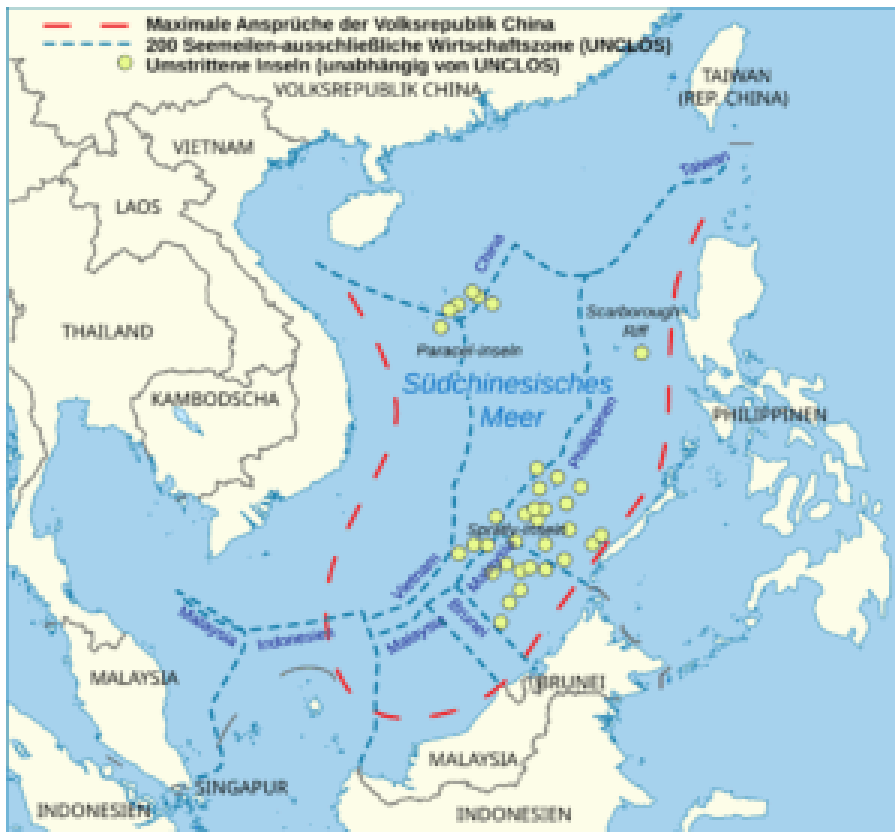
Die territorialen Ansprüche im Südchinesischen Meer © Furfur auf Grundlage von Goran tek-en, CC BY-SA 3.0, via Wikimedia

Jahr des Inkrafttretens des UN-Seerechtsübereinkommens) einige Inseln von China und Vietnam zur Behauptung ihrer Einflussgebiete militärisch besetzt wurden, insbesondere die Paracel- und Spratly-Inseln und Riffe. Die Gruppe der Paracel-Inseln und Riffe liegt ca. 200 bis 400 km südlich der chinesischen Inselprovinz Hainan, ca. 250 bis 600 km östlich von Zentralvietnam und 650 bis 850 km westlich der philippinischen Hauptinsel Luzon. Die Gruppe der Spratly-Inseln und Riffe liegt ca. 100 bis 500 km östlich vor den Küsten von Brunei, dem Bundesstaat Sabah von Malaysia auf Borneo und der südlichsten Insel der Philippinen Palawan sowie ca. 400 bis 800 km vor der Küste vom südlichen Teil Vietnams. Umfangreiche Aufschüttungen von kleinsten Inseln und Riffen ab etwa 2010 ermöglichten einen bis heute anhaltenden massiven Auf- und Ausbau von militärischen Einrichtungen zur Absicherung dieser Ansprüche und der Kontrolle der Seewege.