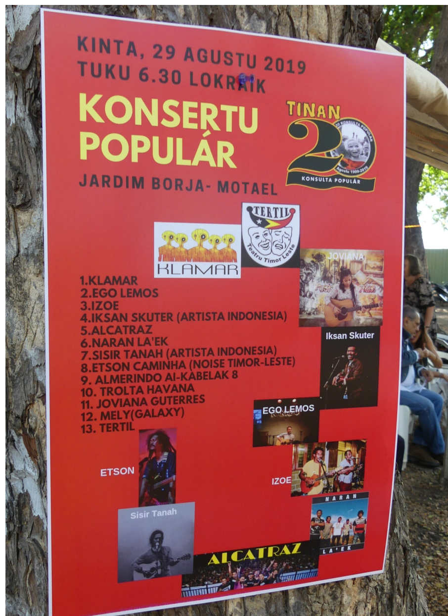
Programm des Konsertu Populár beim Solidarity Festival in Dili

Song dann bei der Buchveröffentlichung vorgetragen. Viele Inspiration und Impulse bekomme ich aus meiner Arbeit. Ich beobachte einfach das Leben, die Menschen, die Situationen. Ich brauche diese nur zu beschreiben, ich muss nichts erfinden. Meine Lieder haben alle einen Bezug zur Menschenrechtsarbeit. Momentan schreibe ich an einem Song zum Gedenken an das Marabia-Massaker (Marabia Community Exhibition), das sich am 10. Juni 1980 zutrug. Wieder erzähle ich die Geschichte aus der Sicht der Überlebenden, samt ihrer Klagen und ihrer Trauer. Musik hat eine starke Rolle während des Widerstandes gespielt und das tut sie auch heute noch.