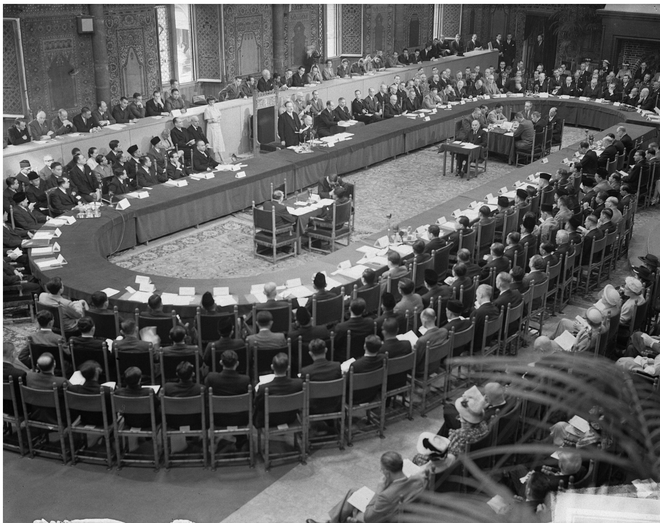
Runder Tisch Konferenz zwischen Indonesien und den Niederlanden in Den Haag, August 1949.

Die Archive von NEFIS und CMI wurden jedoch vor der Unterzeichnung des Abkommens zur Übertragung der Souveränität am 27. Dezember 1949 per Schiff in die Niederlande transportiert. Danach wurden sie viele Male zwischen verschiedenen niederländischen Ministerien hin und her verlegt und vor der Öffentlichkeit geheim gehalten. Diese Archive wurden schließlich im Nationalarchiv untergebracht und 1990 zum Teil der Öffentlichkeit zugänglich gemacht. Hier wurden sie als inbeslaggenomen, gevonden en buitgemaakte (beschlagnahmt, gefunden und gestohlen) bezeichnet und unter einem größeren Inventar von NEFIS/CMI Archive abgelegt (Zugangsnummer 2.10.62). Die gesamten NEFIS/CMI-Archive bestehen aus 75 Metern Akten und sind in 7334 Inventarnummern geordnet, während die versteckten Archive aus 3099 Akten bestehen.