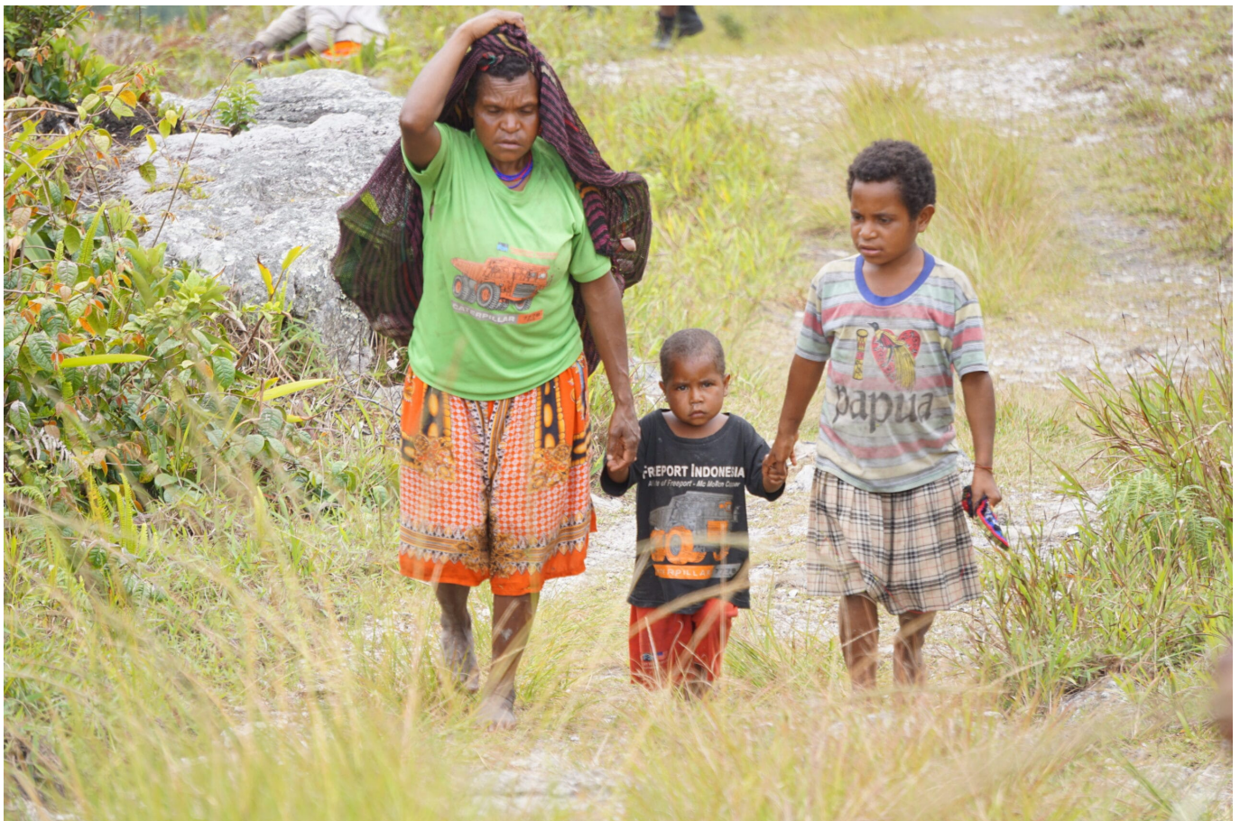
Frau mit ihren Kindern im Dani Gebiet südlich von Wamena, 2018

Werden Angehörige und Freunde als der Widerstandsbewegung zugehörig verdächtigt, werden Frauen bei den von Staatsorganen vollzogenen Befragungen eingeschüchtert, gefoltert, sexuell missbraucht und vergewaltigt. Bei Militäroperationen in ländlichen Gebieten werden ihre Häuser und Gärten zerstört. Es bleibt ihnen oft nichts anderes übrig, als mit ihren Kindern in abgelegene Gebiete zu fliehen, wo sie Hunger und Krankheiten ausgeliefert sind. Zuletzt ist dies Ende 2018 im Bezirk Nguda geschehen, wo bis heute Hunderte von Menschen im Regenwald ausharren, aus Angst vor Übergriffen des Militärs.