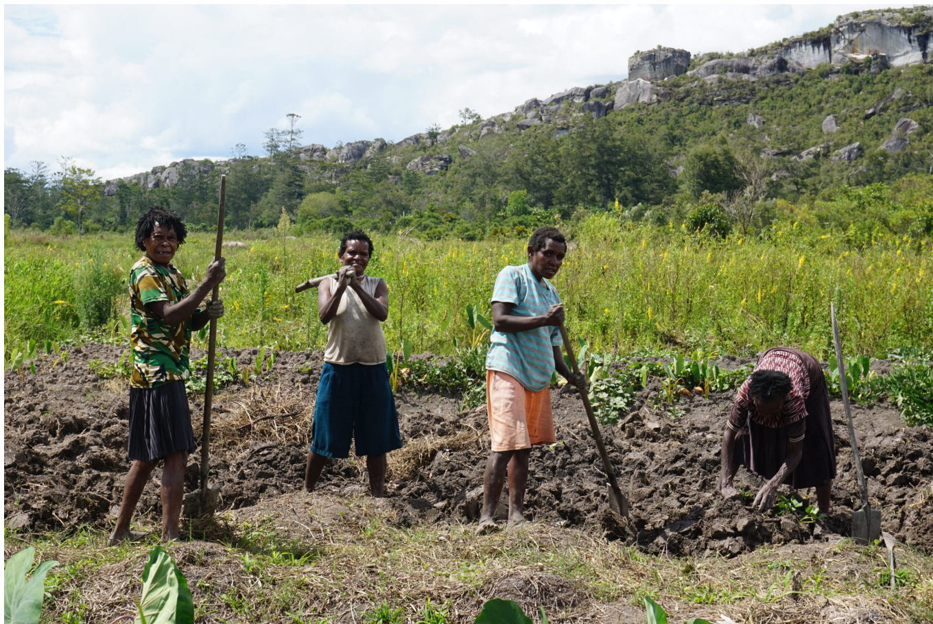
Frauen bei der Gartenarbeit auf fruchtbaren Feldern im Baliem-Tal, Umgebung von Wamena, 2018