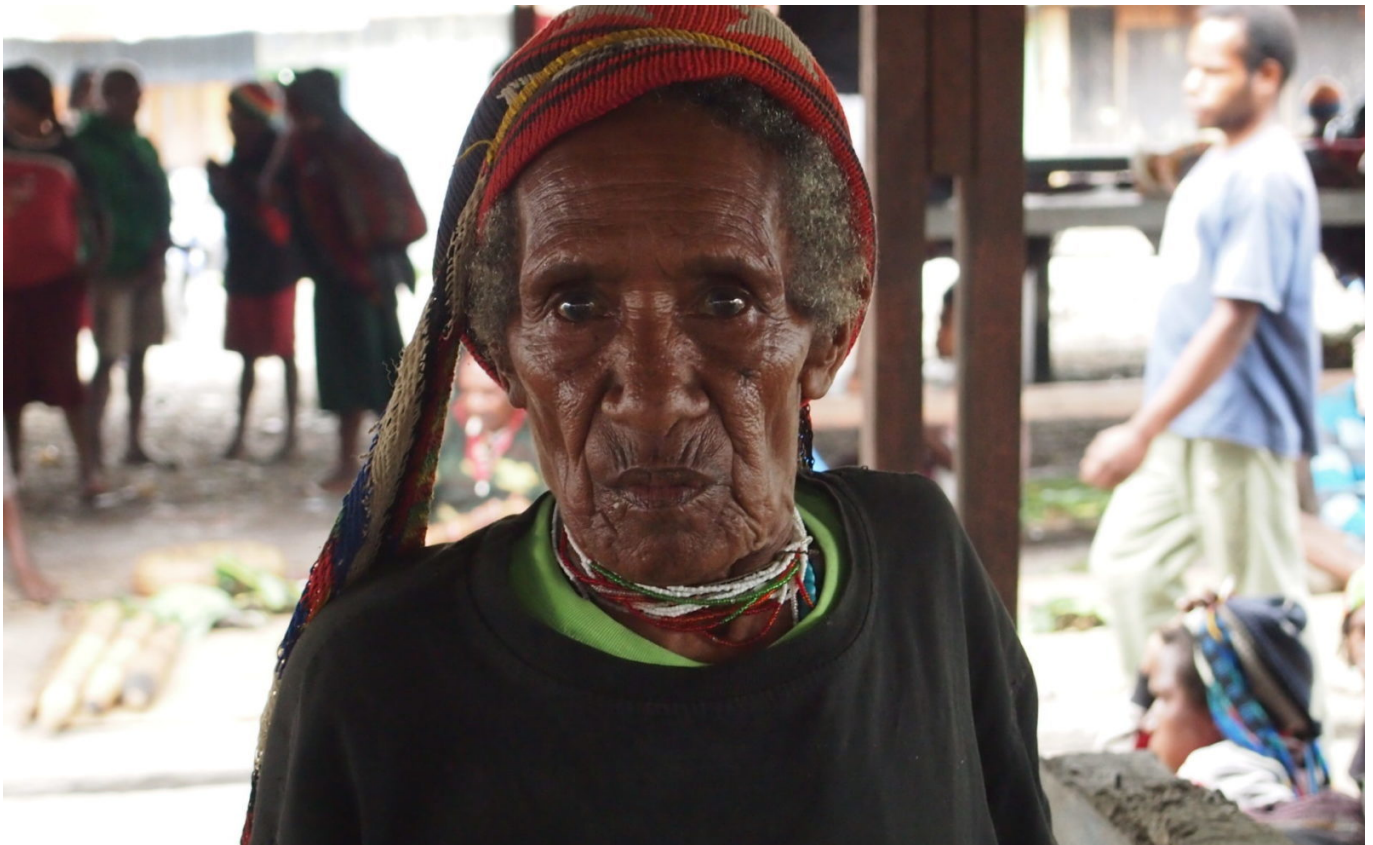
Alte Frau auf dem Markt in Wamena, Papua-Hochland, 2013

In Indonesiens östlichsten Provinzen Papua und West Papua sind Frauen massiver Gewalt durch Militärs und Polizisten ausgesetzt. Außerdem ist häusliche Gewalt äußerst weit verbreitet.