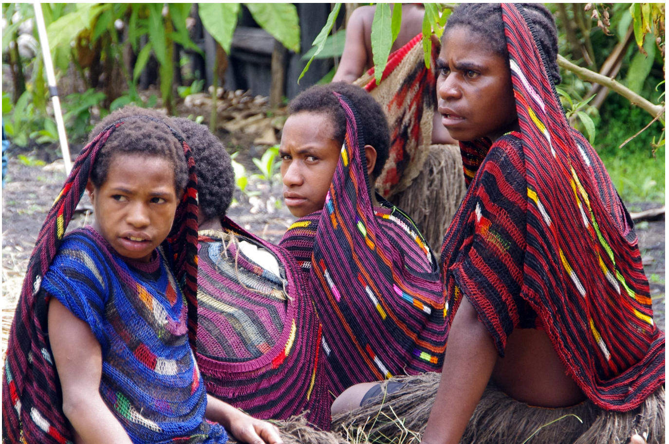
Mädchen während eines Schweinefestes in Soroba im Baliem-Tal, 2012

Hinzu kommt, dass die jahrzehntelange Diskriminierung durch Indonesien mit den althergebrachten tribalen Männlichkeitsidealen kollidiert, die den Mann als kämpferisch und siegreich stilisieren. Was von den Männern stattdessen erlebt wird, ist wirtschaftliche Benachteiligung und politische Unterdrückung. Das führt quasi zwangsläufig zu Verunsicherung und Frustration, die sich oft in Gewalt gegen Frauen ‚Bahn bricht‘. Geldnot, Drogen und Alkohol verschärfen dies.