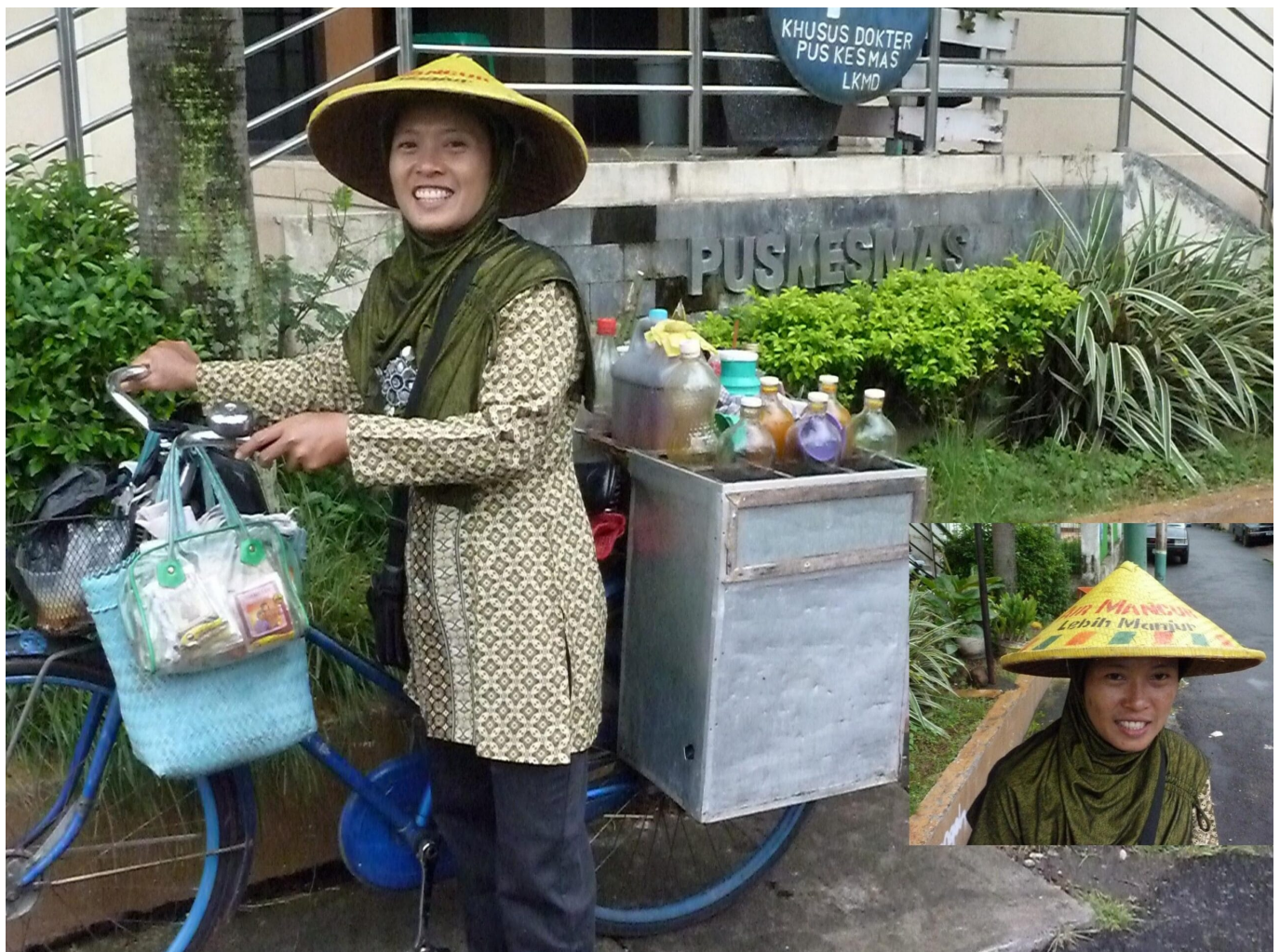
Eine Jamu Gendong Verkäuferin (gendong = tragen) trägt auf ihrem Caping Gunung (traditioneller

Spätestens an dieser Stelle wurde deutlich, dass Gesundheitshandeln kein eindimensionaler Prozess ist, sondern komplexe äußere Einflüsse, Dynamiken und medizinische Traditionen darin eine Rolle spielen. Die Herausforderungen der Covid-19-Pandemie können somit aus verschiedenen medizinischen Perspektiven betrachtet werden, die sich nicht notwendigerweise gegenseitig ausschließen. Während die WHO grundlegend aus einem biomedizinischen Verständnis die Beurteilung der aktuellen Pandemie vornimmt, handelten einige indonesische Politiker*innen ebenso wie viele Bürger*innen aus einem traditionell javanischen Medizinverständnis heraus. Anstatt die Aufrufe von Jokowi und anderen indonesischen Funktionsträgern sowie das damit verknüpfte humorale Körperverständnis, das auf den Körpersäften und den damit verbundenen vier Elementen beruht, rundweg abzulehnen, könnte ein Blick in den medizinischen Pluralismus Indonesiens und die damit verbundenen informellen Kooperationen im Gesundheitssystem sehr lehrreich sein.