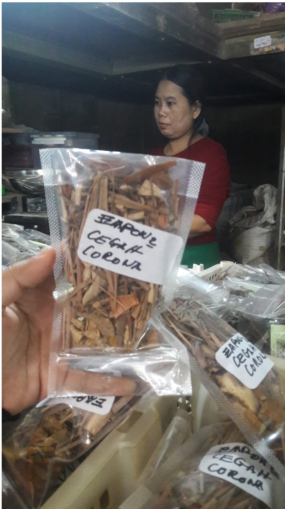
Hausgemachte Anti-Corona Jamu -Kräutermedizin, verkauft auf dem Beringharjo-Markt in Yogyakarta

Die jüngste Geschichte liefert einige gute Gründe, warum medizinische Fachkräfte, Patient*innen