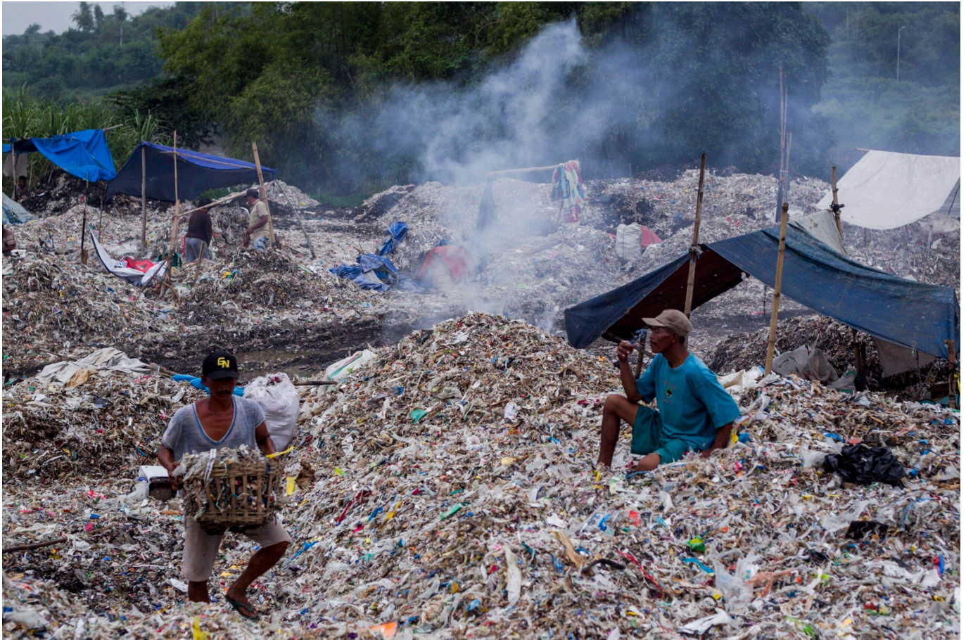
Enormes Risiko für Mensch und Umwelt: Importierter Müll auf einer offenen Deponie in Indonesien

Indonesien: Recycling soll Ressourcen und somit auch das Klima schützen. Doch statt des für die indonesischen Papierfabriken benötigten Altpapiers beinhalteten importierte Container bis zu 70 Prozent Plastik. Das landet direkt in der Umwelt oder wird verbrannt – sogar in Tofufabriken.