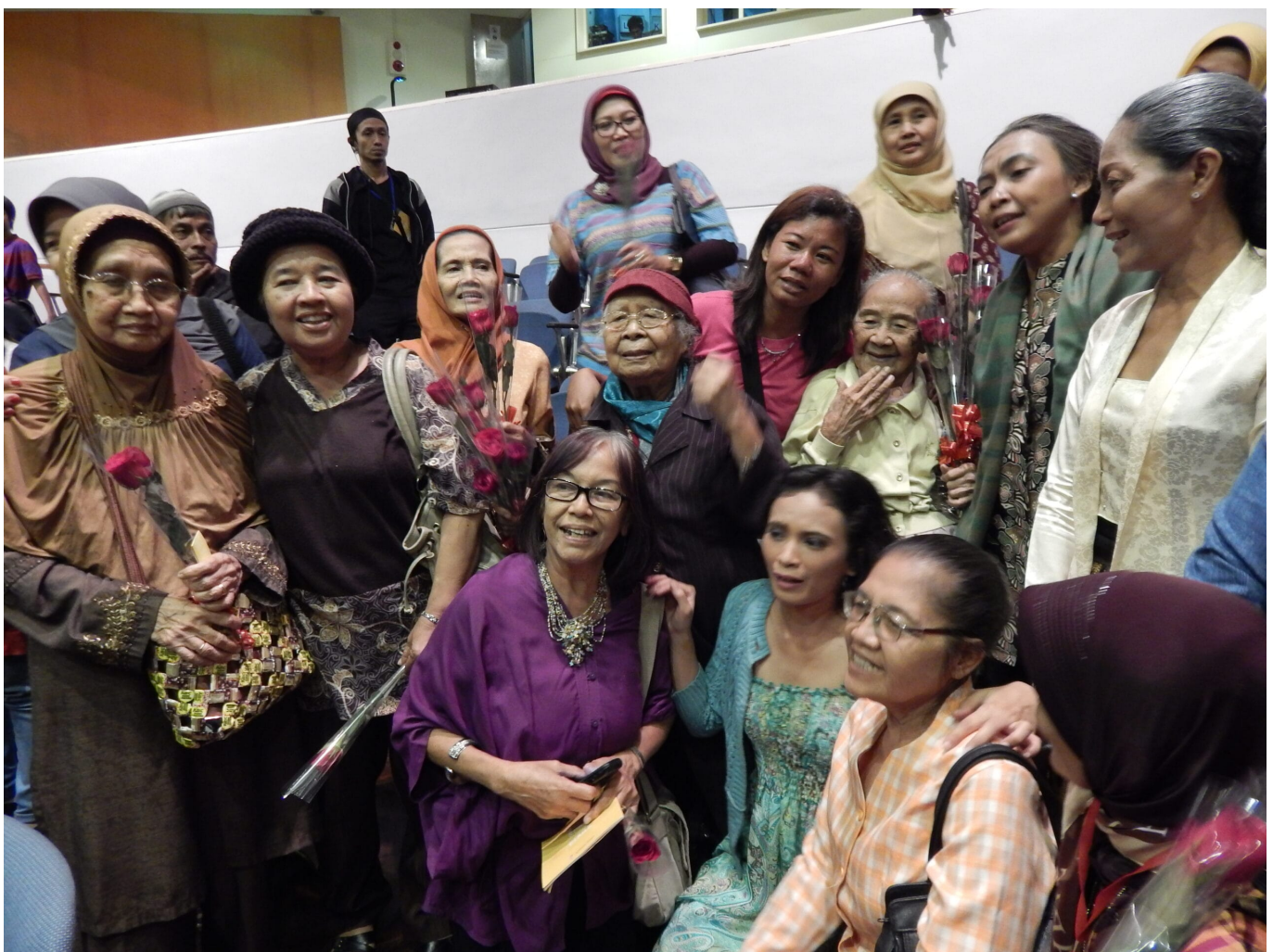
Weibliche Überlebende der Massaker von 1965 mit Schauspielerinnen des 2014 uraufgeführten Theaterstückes Nyanyi Sunyi Kembang-Kembang Genjer/Der schweigende Gesang der Genjer-Blüte .

Diese staatlich verordneten Frauenrollen wurden zu einer Ideologie für jede Frauenorganisation, unter dem Vorwand, dass Mütter oder Frauen dafür verantwortlich seien, eine harmonische Familie zu erhalten und die Entwicklung des Landes zu unterstützen. Die Vereinnahmung der Frauenrolle durch Frauenorganisationen, die vom Staat auferlegt wurde, war sehr effektiv.