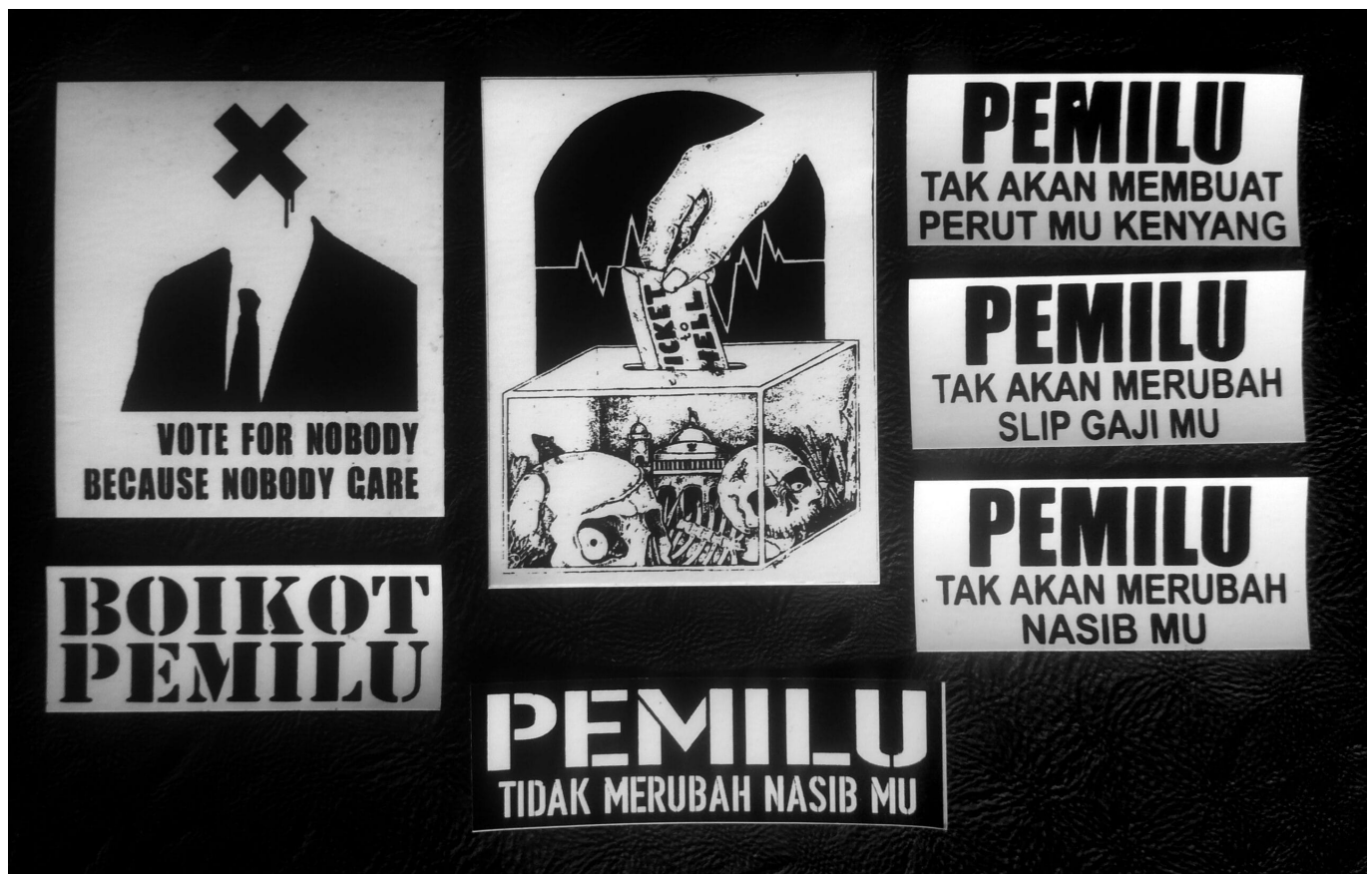
Proteststicker gegen die Wahlen 2019, fotografiert in Bandung

In der Euphorie der reformasi 1998 im gerade demokratisch gewordenen Indonesien liegen gleichzeitig auch die Ursprünge der Bruchstellen dieser Demokratie. Die Verankerung staatsbürgerlicher Rechte braucht emanzipatorisches Potential der Bürger*innen, um freie, vollständige und gleiche Teilnahme im politischen und musikalischen Leben zu erreichen. Dieses Potenzial kann auch als Mittel des Kampfes und des Widerstands gegen Einschränkungen der bürgerlichen Rechte genutzt werden. Wie Karl Marx bereits 1843 anmerkte: „Wir zeigen [der Welt] nur, warum sie eigentlich kämpft, und das Bewusstsein ist etwas, das sie sich aneignen muss, wenn sie auch nicht will.“