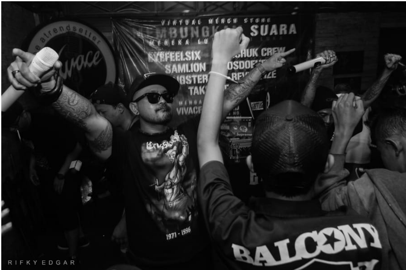
Die Band Eyefeelsix bei einem Auftritt