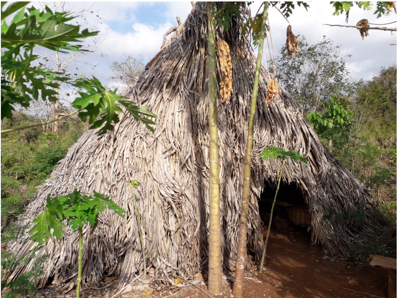
Traditionelle Raststätte im Mamar -Gebiet

Durch die Abholzung der Mamar -Gebiete, vor allem in der ersten und zweiten Zone, wird es direkte Auswirkungen auf die Wasserverfügbarkeit geben. Wasserquellen werden weniger werden und schließlich ganz verschwinden. Das Fehlen von Wasserquellen wird in der Zukunft enorme Folgen für die Gartenbau-Aktivitäten im Dorf Ponain haben, da diese Aktivitäten stark von der Wasserverfügbarkeit abhängen. Es besteht das Dilemma, entweder die Mamar -Systeme beizubehalten oder sie in ein Vollkultursystem umzuwandeln. Gleichzeitig wächst die Nachfrage nach Gartenbauprodukten in Kupang, der Hauptstadt von Ost-Nusa Tenggara.