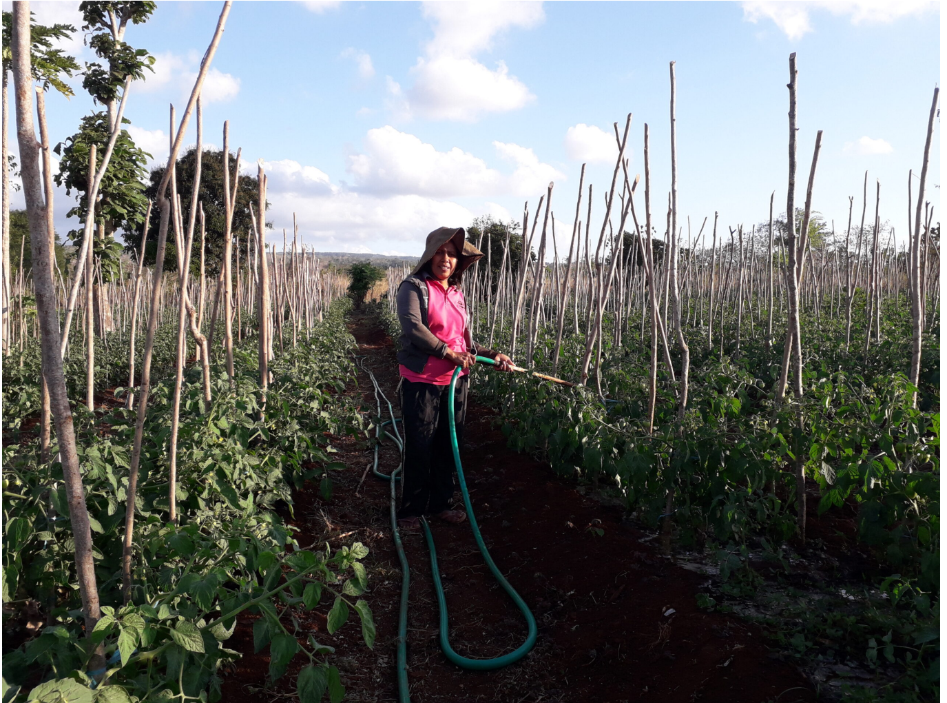
Landwirtin bewässert Kulturen in der äußeren Schicht von Mamar

Gibt es einen Ausweg aus diesen beiden Dilemmata? In diesem Abschnitt wird die Möglichkeit erörtert, das traditionelle Recht im Dorf Ponain wiederzubeleben. Traditionelles Recht könnte künftige Abholzung verhindern und das Bewusstsein der Jugendlichen für den Erhalt des Mamar -Systems stärken.