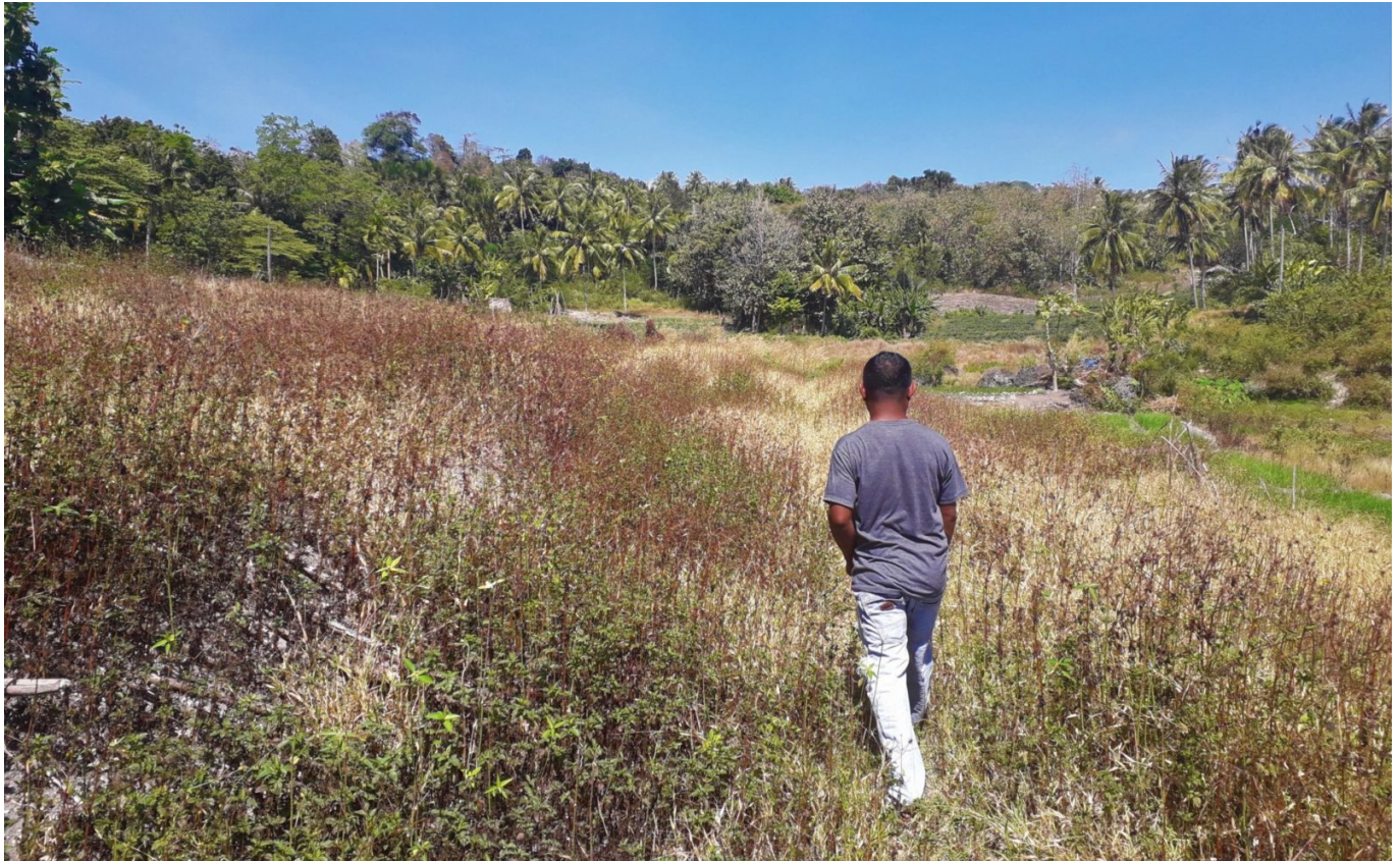
Ein Dorfbewohner im Mamar -Gebiet auf der Insel Timor (Westtimor) in Indonesien

Indonesien: Agroforstwirtschaft wird in Westtimor durch Landnutzungsänderungen und der Land-Stadt-Migration junger Menschen zunehmend bedroht. Die Ernährungssicherheit der Agroforstgemeinden gerät dadurch in Gefahr.