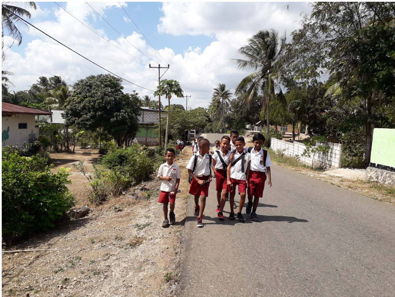
Schüler*innen gehen im Dorf Ponain zur Schule