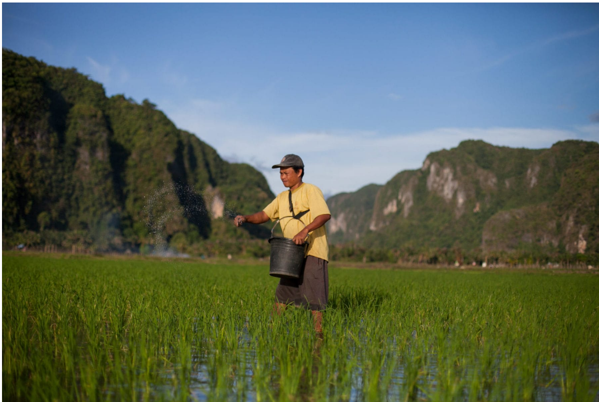
Bauer beim Düngen eines Feldes in Pangkep, Südsulawesi, Indonesien

Indonesiens Agro-Nationalismus hat in den vergangenen zehn Jahren an Bedeutung gewonnen. Im Mittelpunkt der agro-nationalistischen Agenda der Regierung steht das Ziel, die Produktion einheimischer Nahrungsmittel zur nationalen Selbstversorgung zu erreichen. Dies hat dazu geführt, dass die Regierung Land für die landwirtschaftliche Produktion bewahrt und erschlossen, eine Anti-Lebensmittelimport-Agenda gefördert, die Zentralisierung des Agrarsektors reguliert und die agrarische Identität Indonesiens in Politik und Propaganda betont hat. Zur Unterstützung dieser Maßnahmen hat die Regierung den Agrarsektor mit immer höheren Subventionen unterstützt.