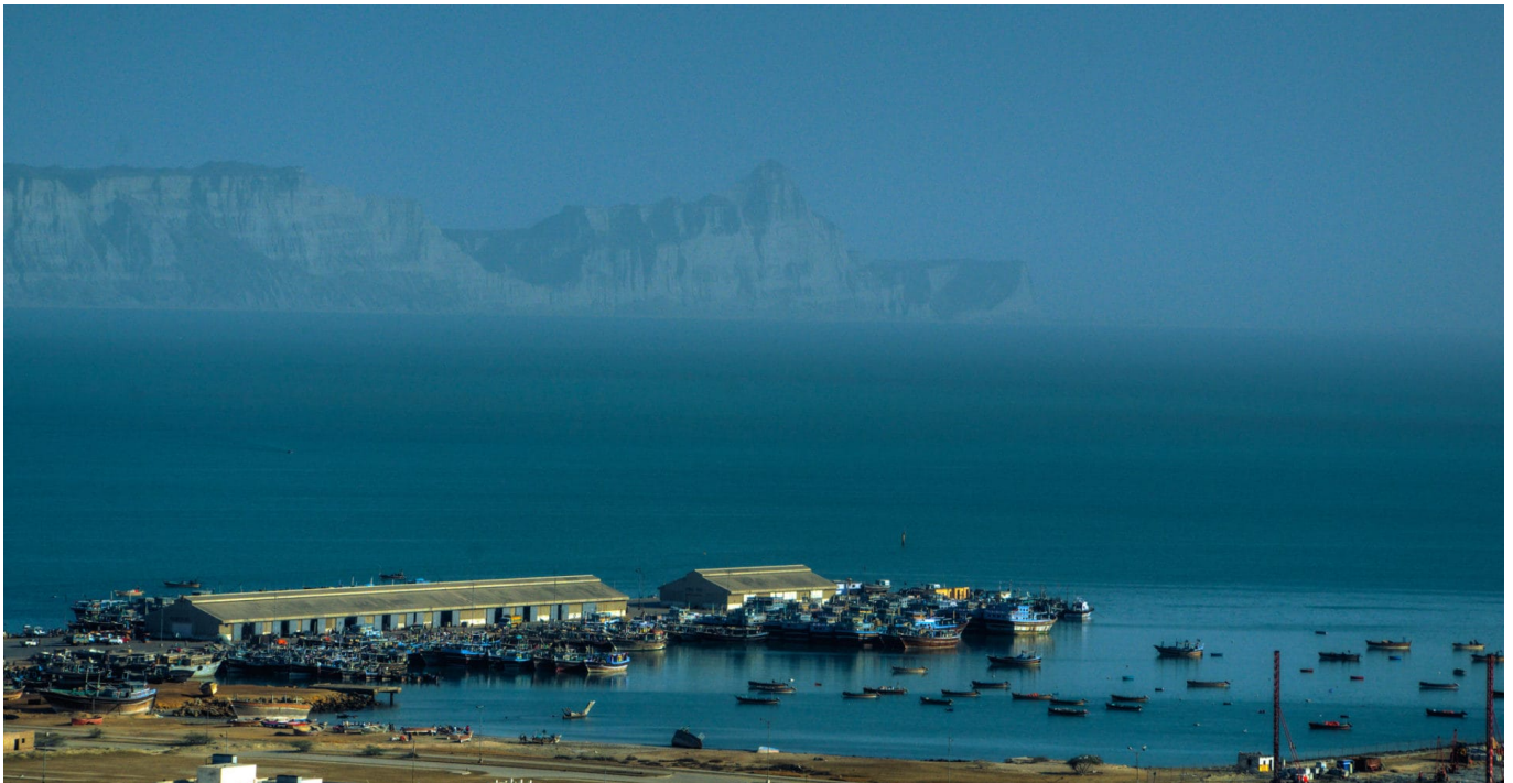
Gwadar - Herzstück des China-Pakistan Wirtschaftskorridors

Pakistan nimmt am BRI seit 2015 teil und vereinbarte den chinesisch-pakistanischen Wirtschaftskorridor China-Pakistan Economic Corridor (CPEC). Beide Seiten haben hier 49 Abkommen im Gesamtwert von 46 Milliarden US-Dollar verabredet. Mit weiteren, geplanten Abkommen beläuft sich das Volumen des CPEC auf insgesamt 60 Milliarden US-Dollar. Zunehmend beklagen jedoch kleinere und mittelständische Unternehmen offen ihre Statistenrolle gegenüber Firmen und Finanzgebern aus China bei der Auftragsvergabe im Rahmen der BRI.