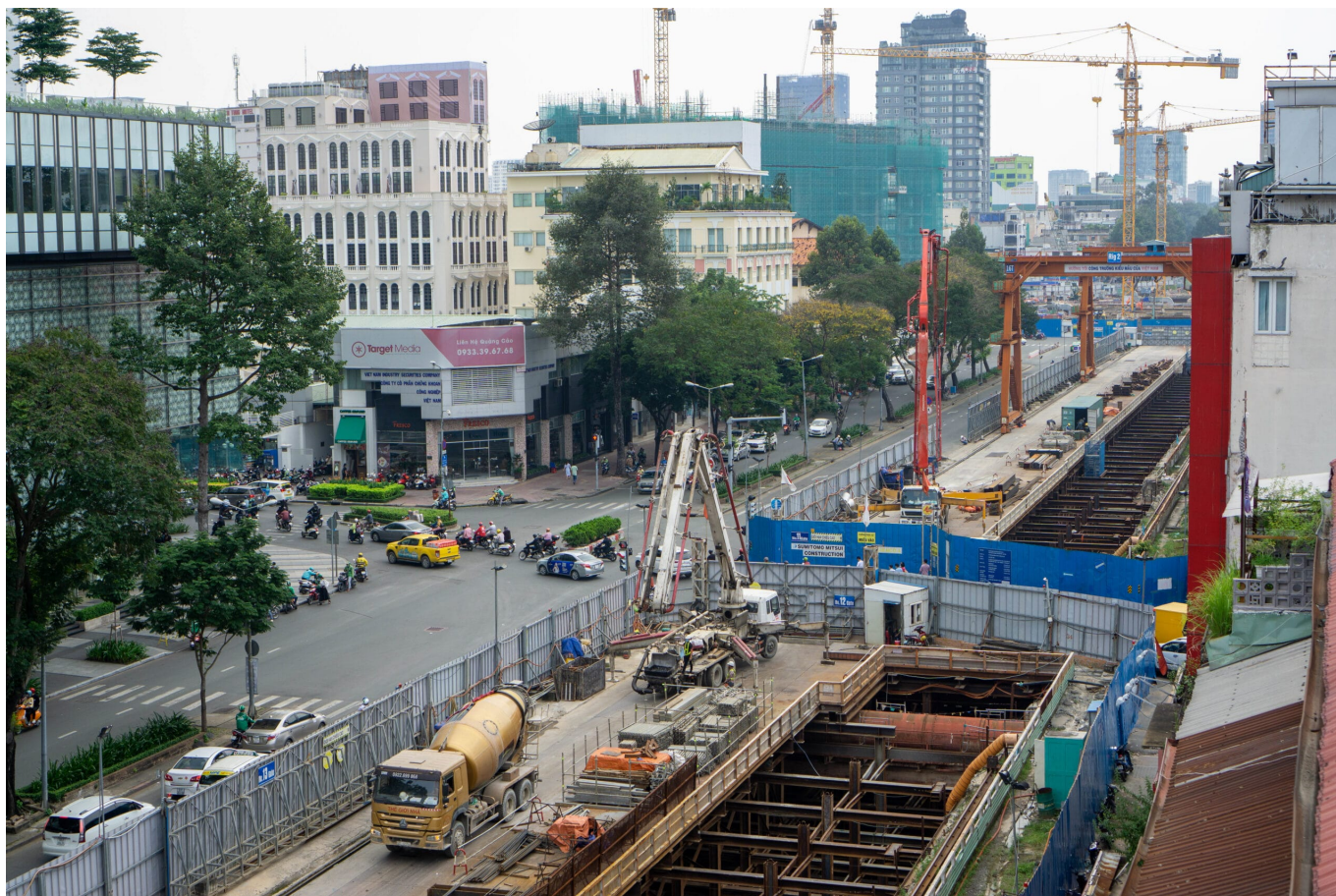
Bau der Metro in Ho Chi Minh City

Vietnam gilt in Südostasien als Antagonist Chinas, ist aber kein lautstarker Kritiker der BRI. Hanoi scheut davor zurück, offiziell ein BRI-Projekt zu beantragen. Die Regierung hat gleichwohl ihre Bereitschaft offenbart, mit Hilfe Chinas ein Infrastrukturnetz für den Schienenverkehr aufzubauen, um etwa Nordvietnam mit den Provinzen Guangxi und Yunnan zu verbinden. Auch Infrastrukturprojekte in Hanoi, unter anderem die U-Bahn, sind mit Chinas Unterstützung im Bau – hier zunächst mit einem BRI-Kredit von 250 Millionen US-Dollar. Für das Image des BRI in Vietnam nicht unbedingt gut: Der 2017 begonnene Bau der U-Bahn wurde Ende 2020 nur eingeschränkt fertig, überschritt das Budget und gilt als unsicher. Das U-Bahn-Projekt in Ho-Chi Minh-Stadt im Süden ging an einen japanischen Bieter.