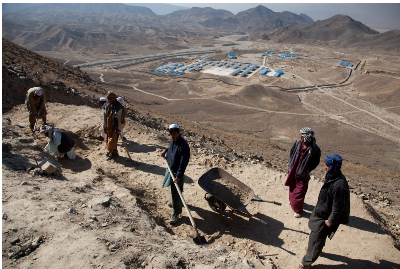
Kupfermine von Nes Ainak in Afghanistan

Afghanistan verknüpft die Wertschöpfung seiner Mineralien an Investitionen aus China und muss dabei die im ersten Teil dieses Artikels erwähnte informelle Dimension zur Kenntnis nehmen. Ein enormer Korruptionsfall beim riesigen Kupfervorkommen in Mes Aynak, südöstlich von Kabul in der Provinz Logar, brachte das Bergbauprojekt zum Erliegen. Ein Spionageskandal im Dezember 2020 beförderte ans Licht, dass China, Pakistan und Afghanistan nachrichtendienstliche Informationen zur Terrorismusbekämpfung austauschen, wobei die wesentlichen Ermittlungsvorgaben dem Interesse Chinas mit Blick auf die Uiguren geschuldet sind.