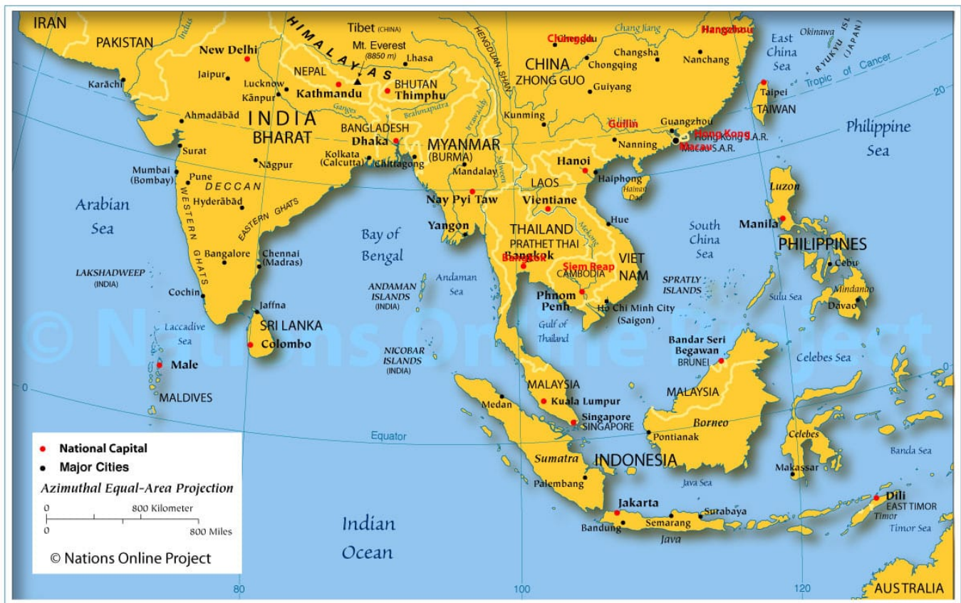
Karte von Süd-, Ost- und Südostasien (zum Vergrößern Klicken)

Die relative Nähe zu den Nachbarn Myanmar, Vietnam und Kambodscha fördert den Eindruck, China versuche über Handel Einfluss zu nehmen, um sich in Südostasien mittels BRI im jeweils nationalen Interesse zu etablieren. Verschiedene Bestandteile der jeweiligen Wirtschaften korrespondieren mit dem chinesischen Wirtschaftsmodell.