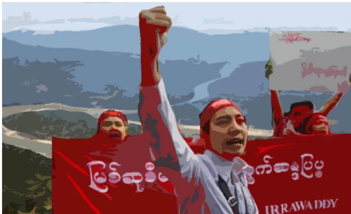
Protest gegen das Myitsone -Dammprojekt

In Südostasien hat sich Kambodscha mehr als jedes andere Land die BRI symbolisch zu Eigen gemacht und sich außenpolitisch eng an China angelehnt. Die Regierung unterzeichnete viele Vorverträge und nahm mit hochrangigen Delegationen an Chinas BRI-Foren teil. Auf der Ebene der Staats- und Parteiführung bestanden bereits vor der BRI enge Beziehungen. Ausdruck davon war die Einrichtung der Sonderwirtschaftszone Sihanoukville, die mittlerweile als BRI-Projekt ausgewiesen wird. China finanziert und baut Straßen (unter anderem die Schnellstraße von Phnom Penh nach Sihanoukville), Brücken, See- und Flughäfen (unter anderem die Dara-Sakor-Zone), Eisenbahnen, Dämme, Wasserkraftwerke und anderes mittels Investitionen in Höhe von rund 7,9 Milliarden US-Dollar. Für ein Land, das bis in das 21. Jahrhundert ökonomisch auf Agrarwirtschaft basierte, ist das eine große Summe.