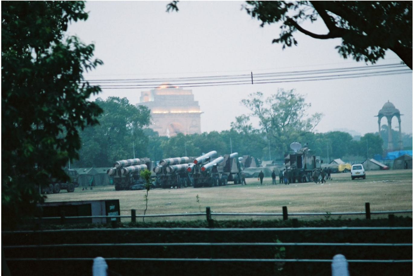
BrahMos Mittelstreckenraketen

Seit dem Amtsantritt von Präsident Duterte 2016 versucht die Regierung, sich aus der engen wirtschaftlichen und militärischen Allianz mit den USA zu lösen und (außen-) politische Brücken zum asiatischen Festland zu schlagen. Im Rahmen der BRI und mittels der von China gegründeten Asiatischen Infrastrukturinvestment Bank flossen Kredite in Höhe von rund 12 Milliarden US-Dollar für das von Duterte betriebene Build-Build-Build -Programm. Der Territorialkonflikt im Südchinesischen Meer um ein Gebiet von bis zu 370 Kilometern westlich der philippinischen Westküste steht allerdings der Umsetzung im Weg. Die Regierung erhebt Anspruch auf eine Exclusive Economic Zone und wird darin durch einen Schiedsspruch des Internationalen Seegerichtshof von 2016 bestätigt. China wiederum baut bereits Stützpunkte auf Inseln und Riffen. Zur Sicherung ihrer Interessen hat die philippinische Regierung im März 2021 eine bilaterale Vereinbarung mit Indien über den Ankauf von indischen BrahMos Mittelstreckenraketen mit einer Kreditlinie von über 100 Millionen US-Dollar unterzeichnet.