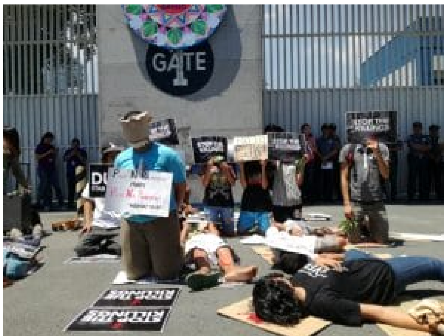
Manila im September 2017: Protest gegen das von der Duterte-Regierung befohlene Morden im so genannten „Drogenkrieg“.

In den folgenden sechs Jahren (2004-2010) ist Ressa und ihrem Team der Umbau von ABS-CBN gelungen, von einem Medienhaus, das zuvor unter staatlicher Kontrolle gestanden habe und vielen Politiker*innen gefällig gewesen sei, schreibt Ressa, hin zu einem führenden Medienunternehmen, dass durch journalistische Qualität und Professionalität überzeuge. Ihre Jahre bei ABS-CBN wurden von politischen Querelen der Regierung Gloria Macapagal Arroyo begleitet. 2006 verhängte die Präsidentin aufgrund von Verschwörungen gegen ihre Regierung den nationalen Notstand, infolge dessen wurden Kritiker*innen, Menschenrechtler*innen und Journalist*innen massiv in ihrer Arbeit eingeschränkt. Auch ABS-CBN wurde mit der Schließung gedroht.