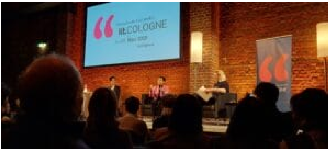
Maria Ressa im März 2023 bei Internationalem Literaturfest Lit Cologne.

Maria Ressa untersucht die Komplexität der Informationslandschaft im digitalen Zeitalter, wie soziale Medien dazu missbraucht wurden, Propaganda zu verbreiten und die Opposition zum Schweigen zu bringen. 2021 kam zum Beispiel heraus, dass die Attacken auf Präsidentschaftskandidatin Leni Robredo und deren Verbreitung online von einer Regierungsstelle finanziert wurden. Ressa's Analyse ist scharfsinnig, und sie liefert den Leser*innen wertvolle Einblicke in die Mechanismen von Online-Desinformationskampagnen und die Herausforderungen, denen Journalisten beim Navigieren durch dieses gefährliche Terrain gegenüberstehen.