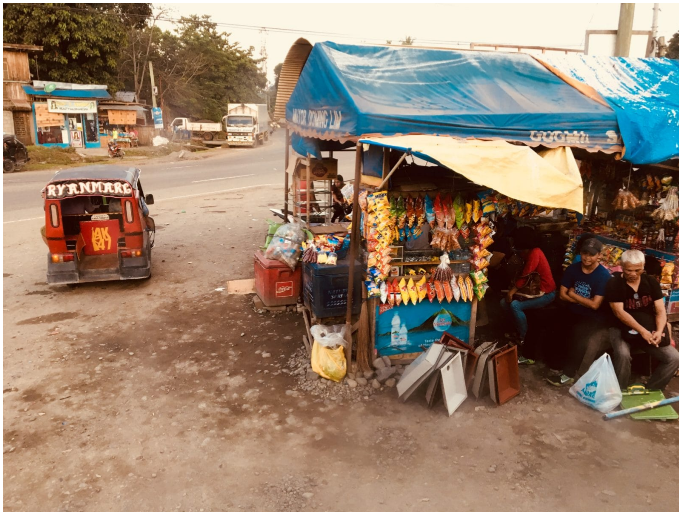
Im Alltag laufen viele Geschäfte am Straßenrand