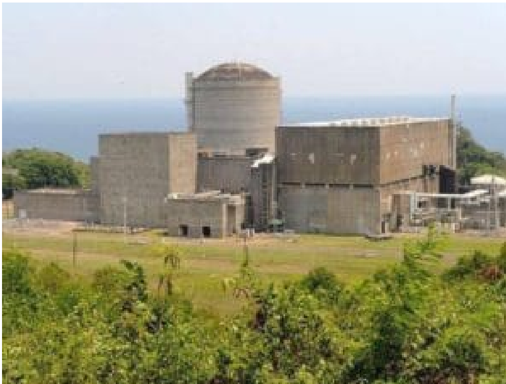
Gebaut, aber nie in Betrieb genommen: das Bataan Nuclear Power Plant BNPP.

Der 5. November 1978 nimmt einen besonderen Platz in der jüngeren Geschichte Österreichs ein. An diesem Tag entschied bei einer Volksabstimmung eine knappe Mehrheit von 50,47 Prozent gegen die Inbetriebnahme des fertig gestellten Atomkraftwerks in Zwentendorf, einem Ort mit rund 4000 Einwohner*innen etwa 40 Kilometer westlich von Wien. Die kommerzielle Nutzung der Kernenergie war somit beendet, ehe sie begonnen hatte. Bestätigt wurde das Ergebnis einige Wochen darauf durch das Atomsperrgesetz, das den Bau von Atomkraftwerken in Österreich verbot. 1999 wurde das Gesetz sogar in den Verfassungsrang gehoben.