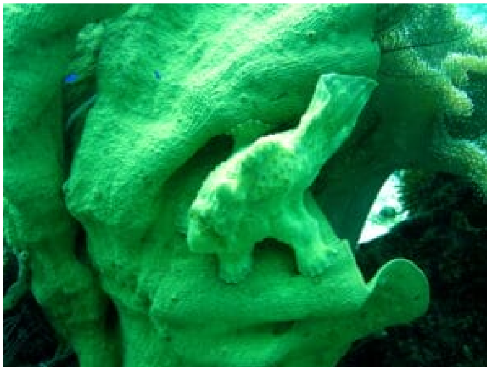
Vom Autor aufgenommener Anglerfisch

Das Tourismusministerium misst dem Tauchtourismus große Bedeutung und ein starkes Wachstumspotenzial zu. Das Ministerium schätzt, dass etwa fünf Prozent der ausländischen Tourist*innen Freizeittaucher*innen sind. Das Einkommen aus Tauchtourismus weltweit wurde für 2022 mit knapp vier Milliarden US-Dollar angegeben. Zahlen für die Philippinen sind nicht bekannt. Man geht aber davon aus, dass Tauchtourist*innen über eine höhere Bildung und ein größeres Einkommen verfügen, mehr Nächte im Land verbringen und pro Tag mehr ausgeben als der Durchschnitt der Tourist*innen. Hinzu kommt eine stark wachsende Zahl einheimischer Taucher*innen.