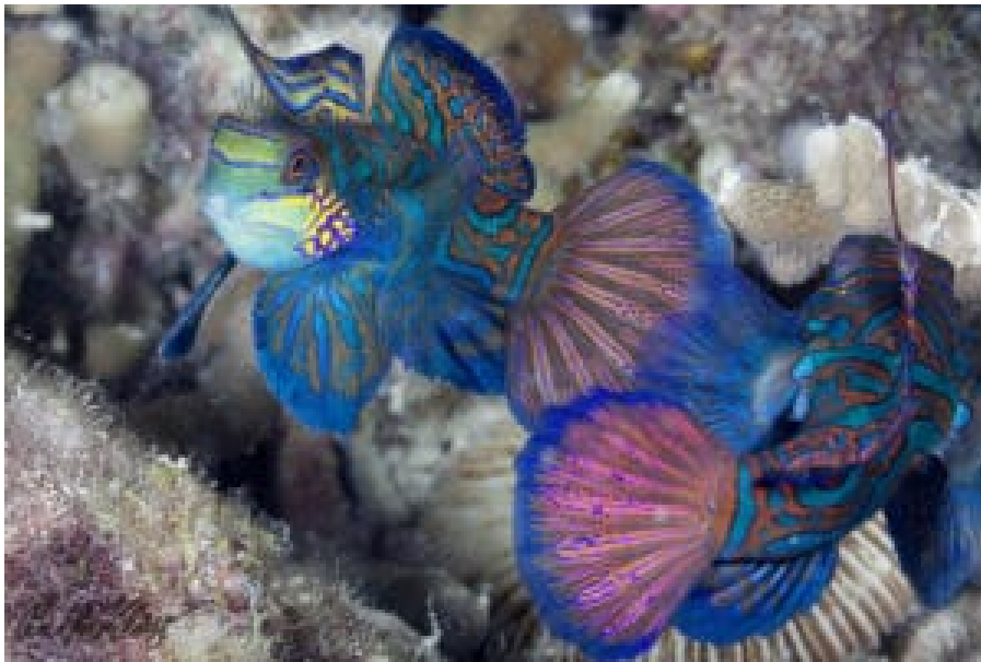
Mandarinfische bei Malapascua.

Die Philippinen liegen im Coral Triangle, dem Weltzentrum der marinen Biodiversität. Hier findet man knapp 600 von insgesamt 800 Riffbildenden Korallen. Zum Vergleich: das australische Great Barrier Reef weist nur knapp 400 Arten auf und liegt damit auf der Biodiversitätsskala an dritter Stelle (Jürgen Freund, Hg.; Sulu-Sulawesi-Seas; Manila 2001). In den philippinischen Wassern findet man 33 Mangrovenarten, 800 Algenarten, mehr als 1.200 Arten von Riffischen, 22 Wal- und Delfinarten. Außerdem leben hier Seekühe ( Dugong ) und Walhaie, die größten Fische der Welt.