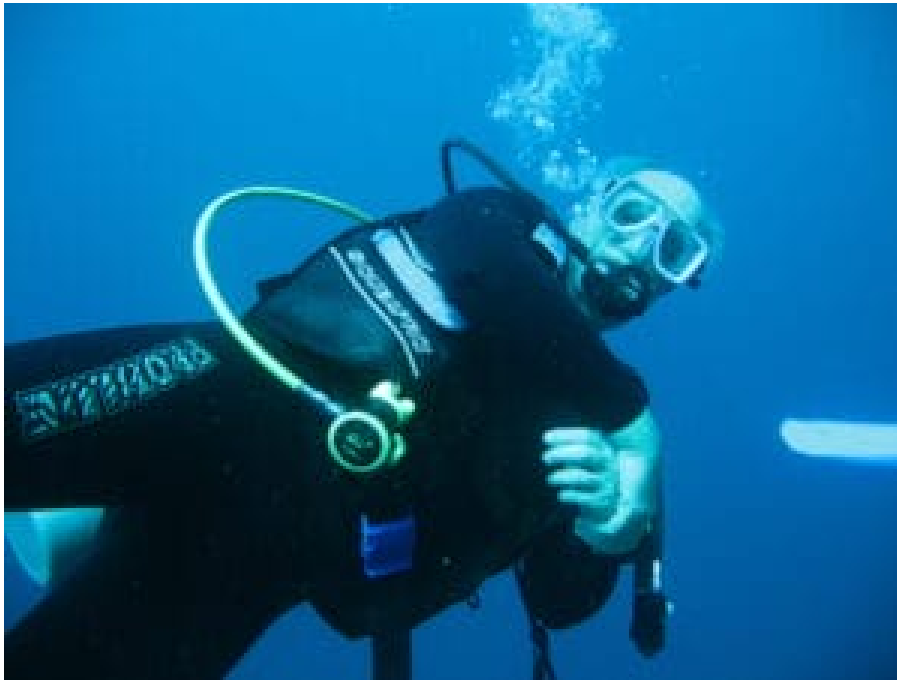
Der Autor unter Wasser.

Halb fünf. Knirschend schiebt sich der Bug des Auslegerboots durch den Sand. Der Boatman gibt einen letzten Stoß, springt auf und wirft den Motor an. Monad Shoal, die versunkene Insel, ist unser Ziel. Ich habe keine Ahnung, wie der Bootsführer sich orientiert, wie er den unsichtbaren Punkt auf dem dunklen Meer ansteuert. Dann springen wir ins Wasser, bald wird die orange-rote Sonne den Horizont erhellen.