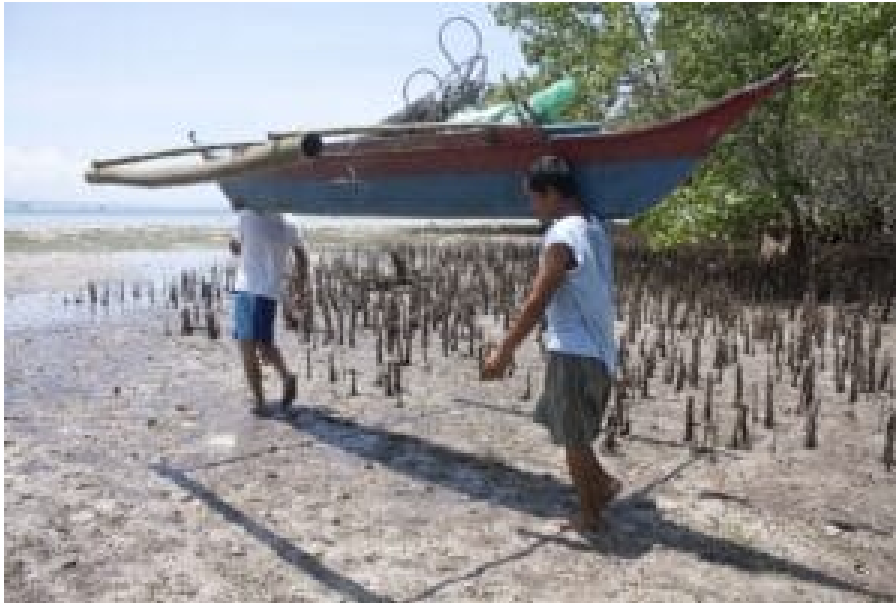
Fischer auf dem Weg zum küstennahen Fischfang

In einer Situation abnehmender Fischbestände greifen Fischer*innen immer häufiger zu destruktiven Methoden. Ich kann mich an keinen einzigen Tauchgang vor der Insel Cebu erinnern, bei dem ich keine Unterwasserexplosion gehört hätte. Dynamit-Fischen ist eine Fischereimethode der Verzweiflung. Dabei werden meist aus Glasflaschen und Sprengstoff selbstgebaute Granaten im Wasser zur Explosion gebracht. Die Druckwelle zerstört die Schwimmblasen der Fische und tötet oder betäubt sie. Diese Methode ist höchst ineffizient, weil von 10 getöteten Fischen nur einer oder zwei an die Oberfläche treiben und eingesammelt werden können, der Rest sinkt zu Boden. Zugleich wird alles Meeresleben im Umkreis geschädigt oder zerstört. Schätzungen gehen davon aus, dass etwa 70.000 der einen Million Kleinfischer*innen in den Philippinen mit Hilfe von Sprengladungen fischen.