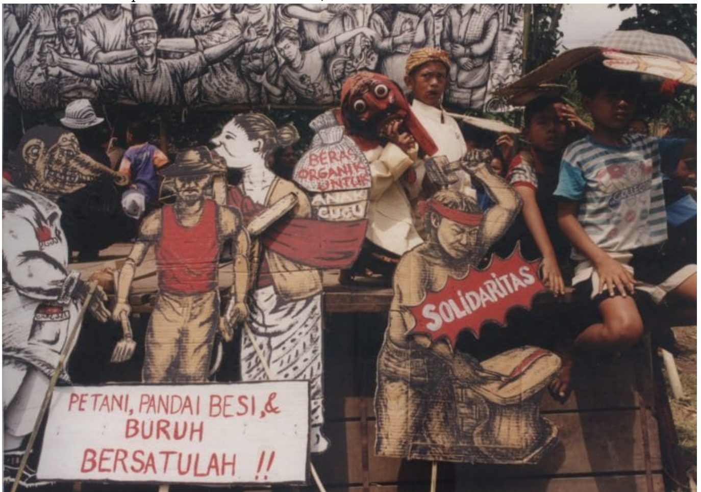
Die Wurzeln des gemeinschaftlichen Arbeitens in der indonesischen Kunst und wie sie sich im letzten Jahrhundert weiterentwickelt hat, analysiert die Kunsthistorikerin Claudia König.