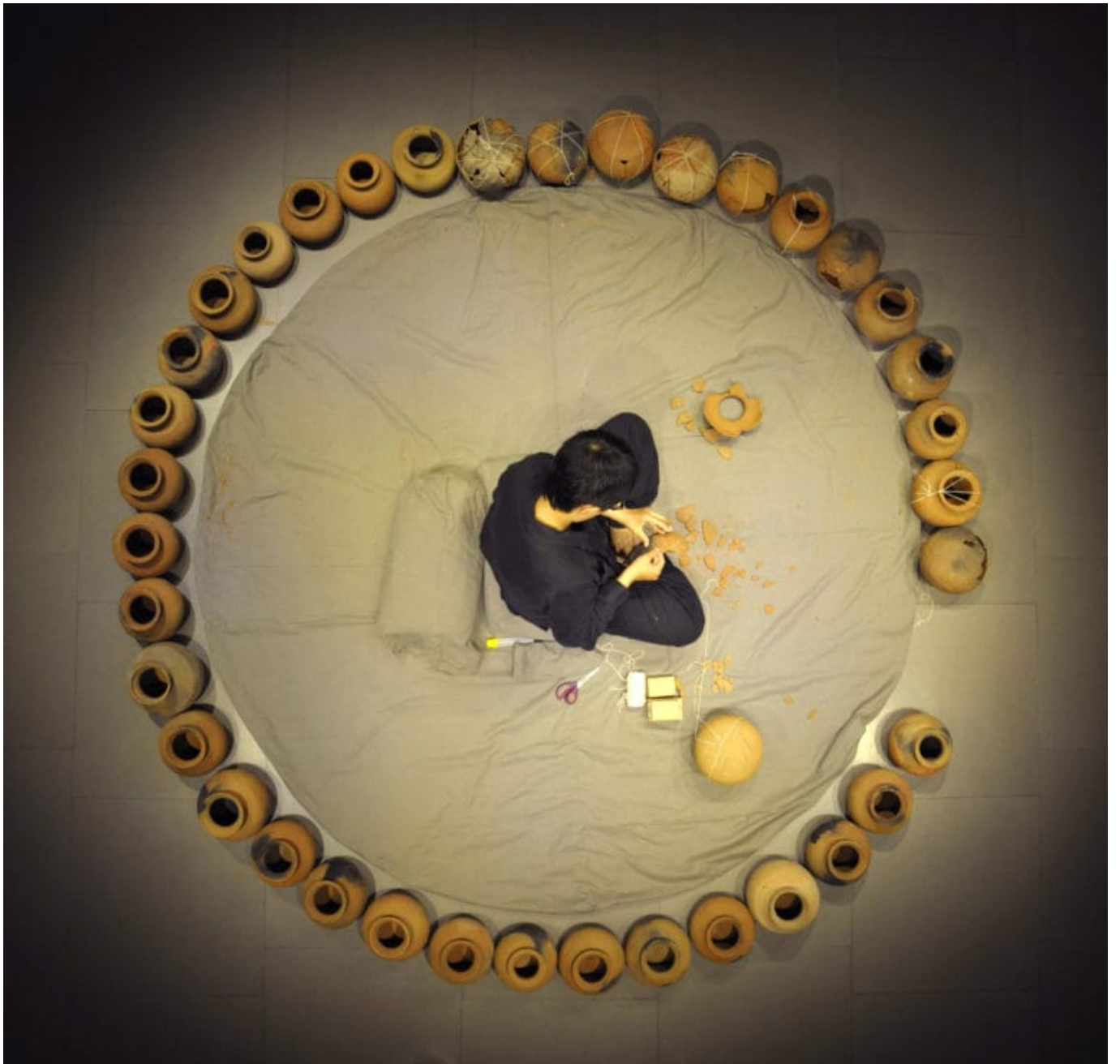
Full Circle performance at Meta House, 2012. © Amy Lee Sanford