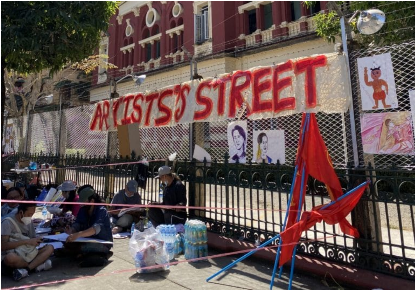
Auch in Myanmar spielen Künstler*innen eine starke, solidarische Rolle für die Gesellschaft, wie Natalie Johnston in ihrem Artikel berichtet.