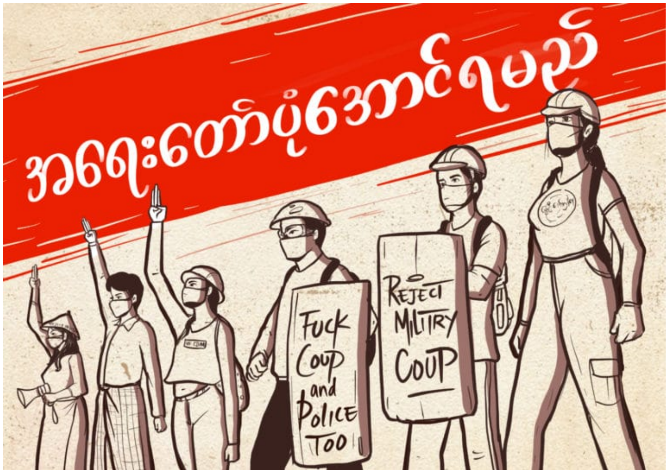
Die Poster der Künstlerin Ku Kue aus Burma/Myanmar begleiten die Proteste gegen das Militärregime. In einer Foto- Story stellen wir sie vor. © Ku Kue