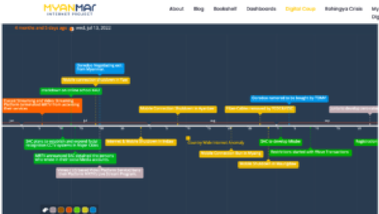
Das Myanmar Internet Project (MIDO) dokumentiert detailliert Eingriffe und Beschränkungen des Internet im Land.

Ich glaube nicht, dass die Junta anfangs eine Strategie hatte. Aber sie versuchte, mit allen Mitteln, diesen Raum zu begrenzen. Am Tag des Putsches wurde das Internet vollständig abgeschaltet. Es gab Online-Sperrstunden und Blacklists. Das passt in ein Muster, kam aber ziemlich ad hoc. Sie versuchte Gesetze zu erlassen, zuerst einen überraschend frühen Entwurf eines Cyber-Sicherheitsgesetzes. Außerdem waren die Telekommunikationsanbieter mit starken Einschränkungen konfrontiert und wurden unter Druck gesetzt, Informationen über die Nutzer*innen bereitzustellen, was zum Ausstieg von Telenor führte. Dazu kommt ein Anstieg der Datenpreise von aktuell bis zu 60 Prozent. Wenn man Erschwinglichkeit und Zugänglichkeit erschwert, kann man Menschen offline halten.