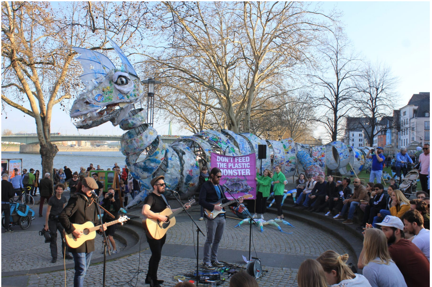
Plastikmonster bei der „Ship it Back“ Kampagne in Köln