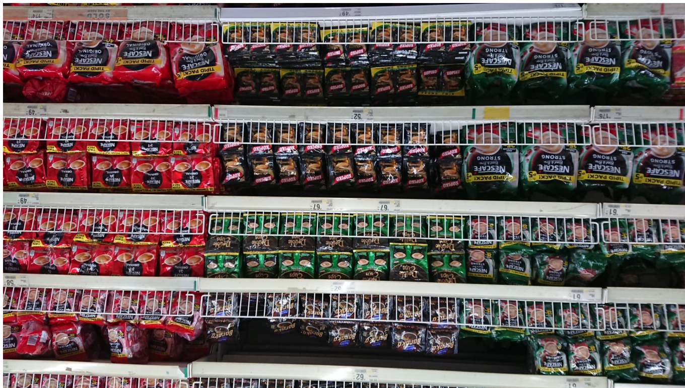
Kaffee-Sachets in philippinischem Supermarkt

In Gesprächen mit Akteur*innen aus Cebu City habe ich einen ähnlichen Eindruck gewonnen, allerdings ist die junge Umweltszene zwar sehr aktiv aber kaum organisiert. Welche Eindrücke hast du von der Umweltbewegung in Manila erhalten?