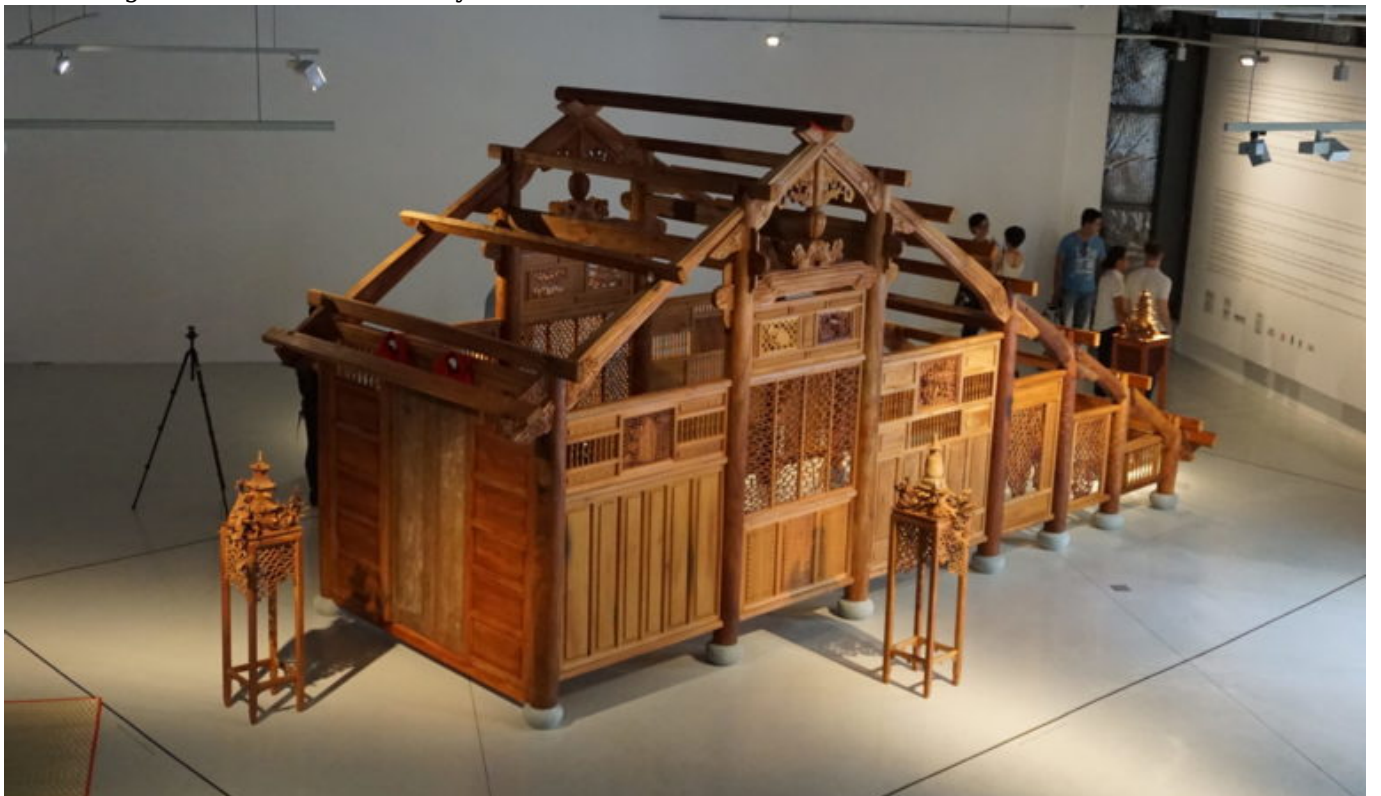
Auf Förderung vom Staat können Künstler*innen in Vietnam nicht bauen. Kuratorin Bùi Kim Đĩnh berichtet, wie dennoch Räume für zeitgenössische Kunst entstehen.