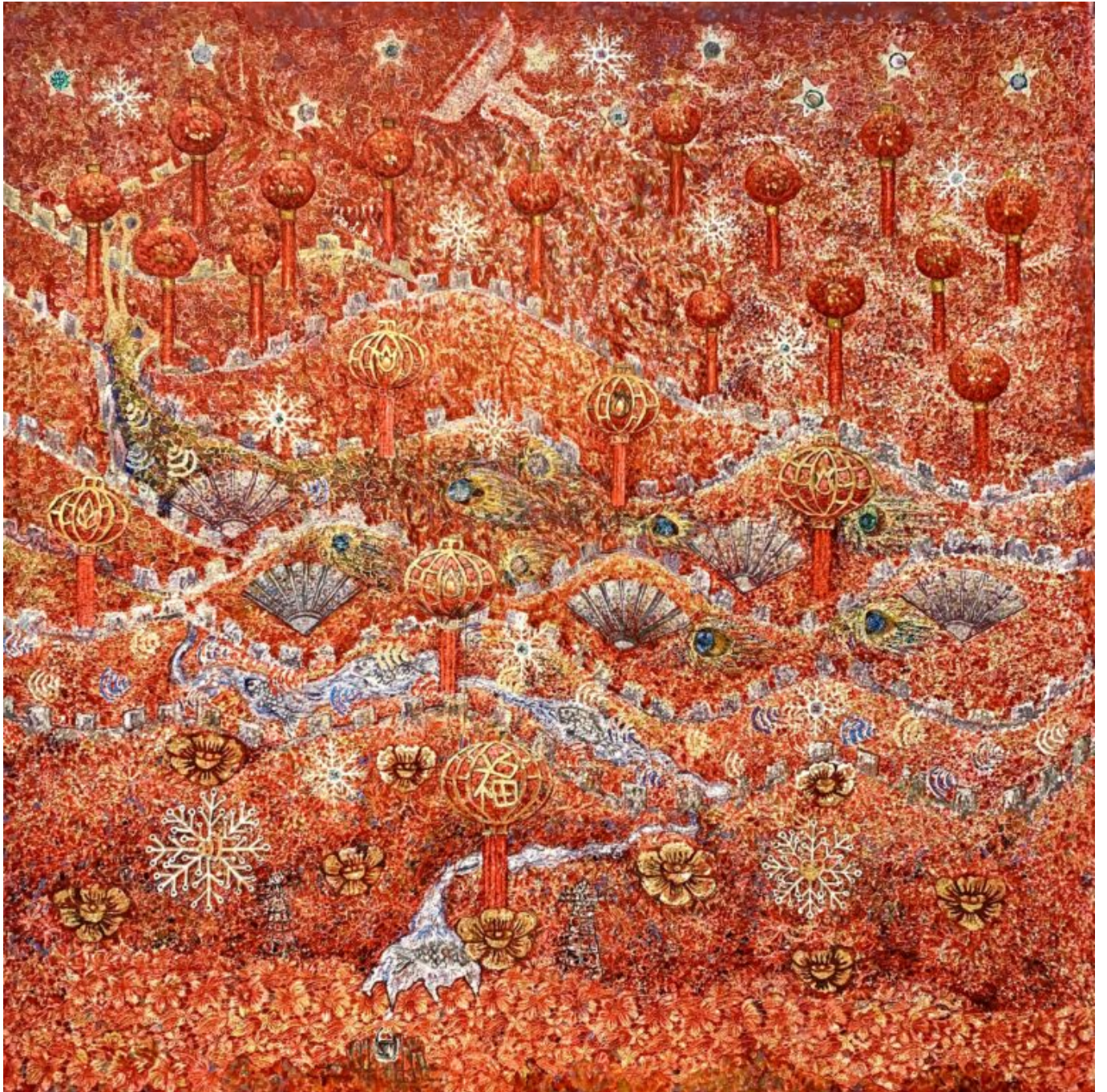
Der kambodschanische Künstler Leang Seckon gewährt im Interview Einblicke in sein Werk, mit dem er politische Strukturen sichtbar macht.