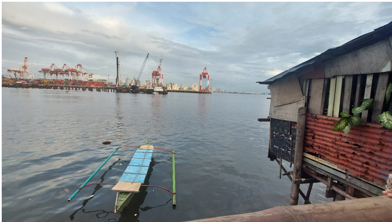
Blick von der Hafendarbeitersiedlung Baseco Compound zum Containerhafen von Manila.