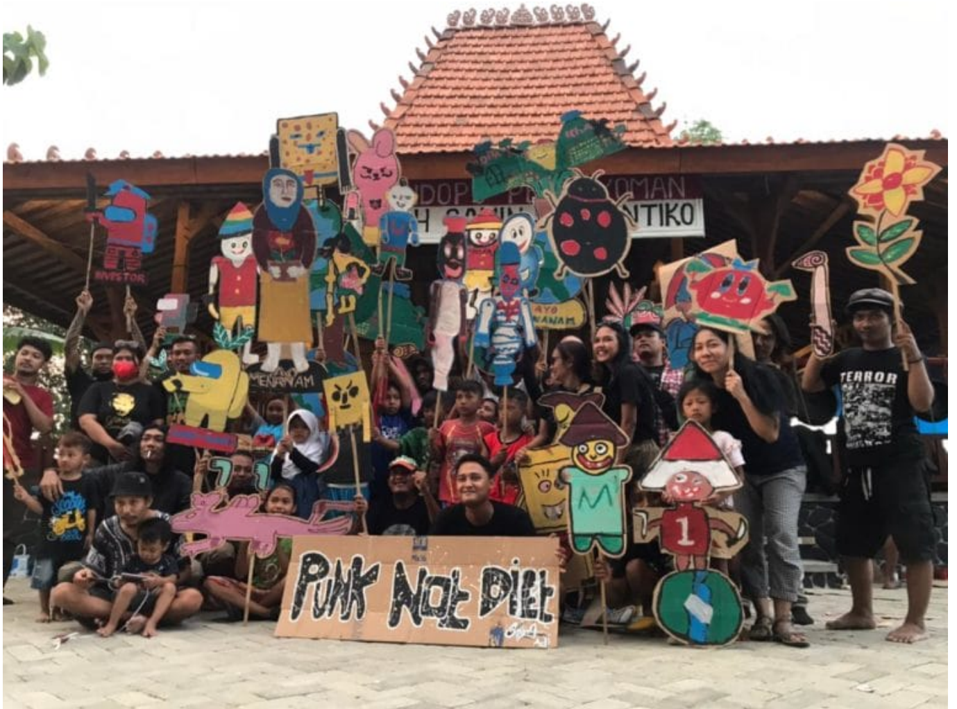
Zehn Künstler*innen und Kunstkollektive aus Südostasien gestalten die documenta fifteen mit. Tanja Gref stellt sie vor.